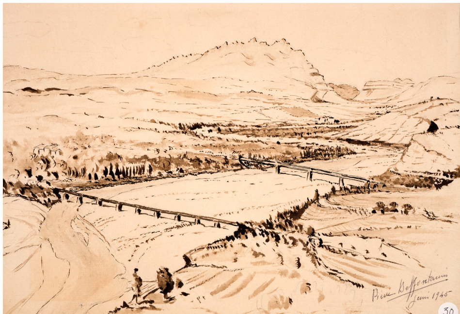
Le Montserrat. Vu de la cluse de Martorell. Juin 1945. Fotografia realitzada a l'exposició a l'IEC. Original a: Biblioteca de Catalunya. XIII Deffontaines B 26 (30 x 22 cm)