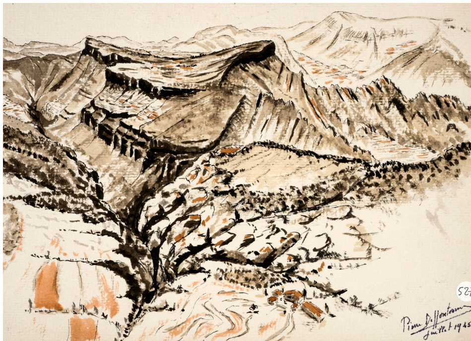
Juillet 1945. / Le plateau de Busa (synclinal perché) près Llinás, Ouest de Berga. 10 juillet 1945. Fotografia realitzada a l'exposició a l'IEC. XIII Deffontaines B 464 (31 x 22 cm)