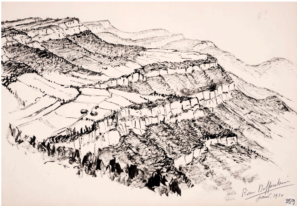
Janv. 1970. / Vue du haut de la Musara vers le Nord, 20 kil. au NW de Reus. Janvier 1970. Fotografia realitzada a l'exposició a l'IEC. Original a: Biblioteca de Catalunya. XIII Deffontaines B 162 (33 x 24 cm)