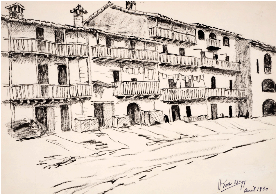
Avril 1960. / Hostalets petit village de la plaine d'Olot à nombreux balcons. 15 avril 1960. Fotografia realitzada a l'exposició a l'IEC. XIII Deffontaines B 241 (33 x 23,5 cm)