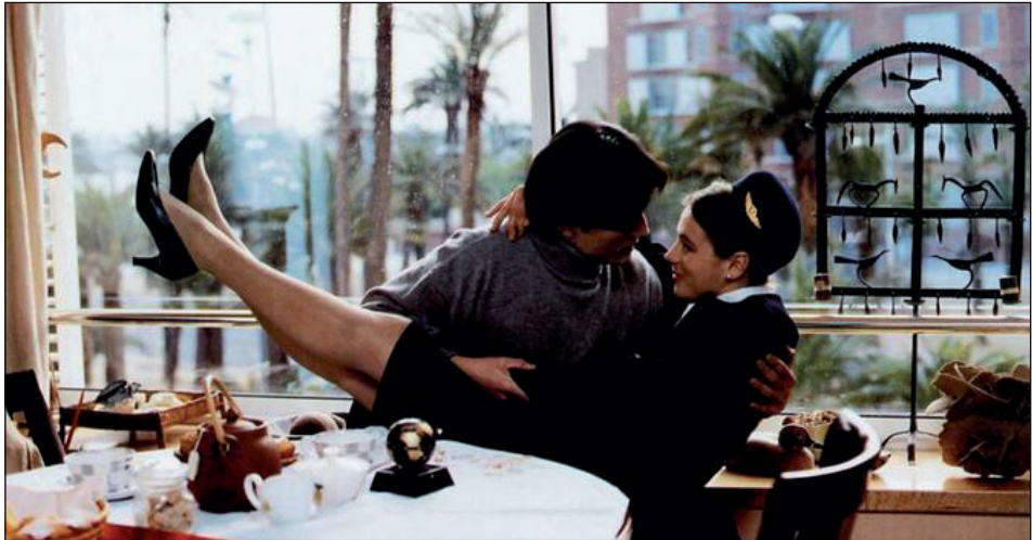
Figura 9. Souvenir (Vergès, 2004)