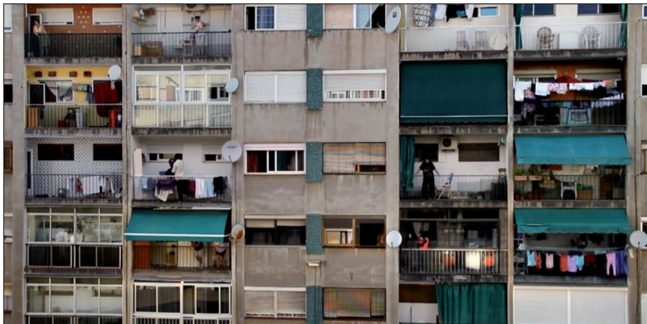
Figura 13. Ciutat Meridiana (Col·lectiu, 2015)