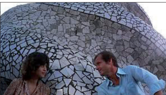
Figura 7. Profesión reporter (Antonioni, 1975)