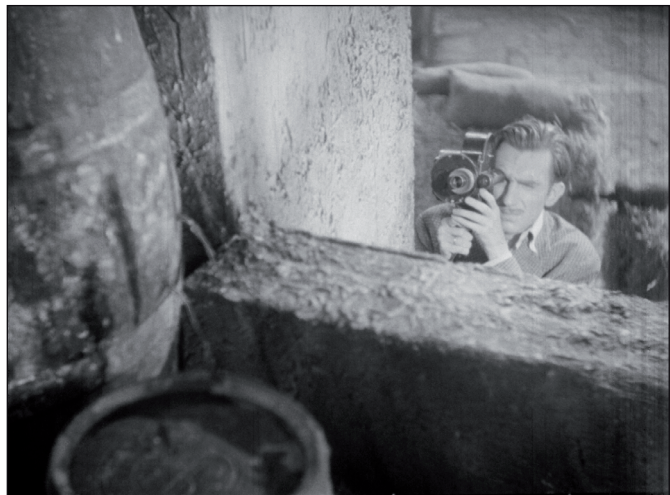
Figura 2. Vida en sombras (Llobet Gràcia, 1947)

Així les coses, d'aquesta època s'ha de constatar l'intent