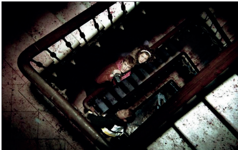
Figura 10. Rec (Balagueró i Plaza, 2007)

Podem veure doncs com, a partir del cinema, podem sentir la transformació de l'apreciació que un té de la ciutat. A un ascens meteòric d'aquesta, que podem situar al voltant de la concessió dels Jocs Olímpics a la ciutat, li segueix una etapa en la qual alguns comencen a veure que els canvis produïts són ben profunds, anant molt més enllà de la qüestió estètica i, a poc a poc, en concordança aproximada amb la crisi econòmica, la lluminositat amb la qual se la considerava i representava va, en una etapa en què ens trobem en l'actualitat, enfosquint-se.