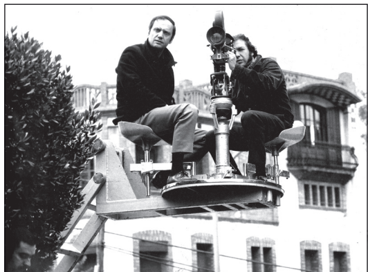
Figura 12. Pere Portabella

A Informe general , acabem de veure la llosa que tapa la tomba de Franco i, aleshores, amb els títols de crèdit sorgeixen gratacels, cases modernistes, en un seguit de plans molt habitual a tota l'obra