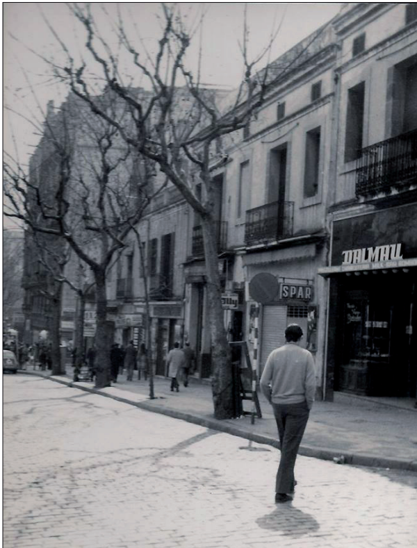
Figura 11. Plaça Lesseps