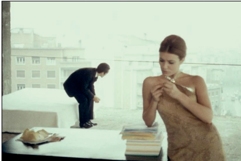
Figura 5. Dante no es únicament severo (Esteva i Jordà, 1967)