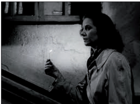
Figura 3. Nada (Neville, 1947)