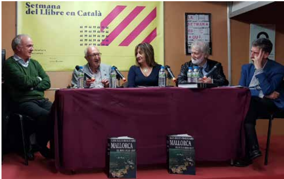
Figura 1. Presentació del llibre a Palma

La geografia regional que analitzava regions natural era força deutora de la geografia francesa que comptava amb la rutilant figura de Paul Vidal de La Blanche (1845-1918). Una influència de la geografia regional francesa que es mantindrà pràcticament fins a la dècada del 1980 quan els paradigmes neopositivistes anglosaxons desplaçin els regionals. Un paradigma regional que assumeix la Historicitat de l'acció humana i la idea de resposta i adaptació «activa» als obstacles del medi (Riudor, 1989, p. 23). Però quan el paradigma