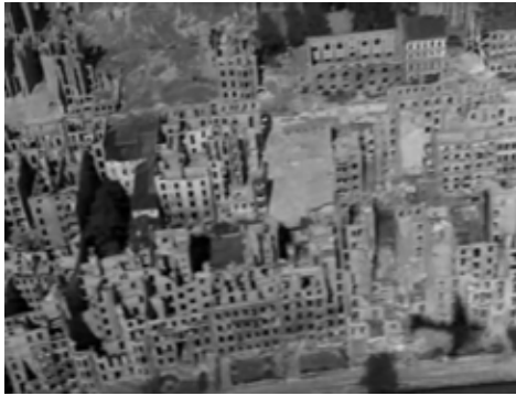
Fig. 4. Berlín Occidente (Wilder, 1948)