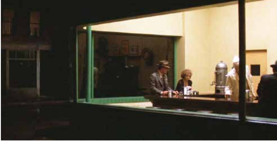
Fig. 14. The end of violence (Wenders, 1997)