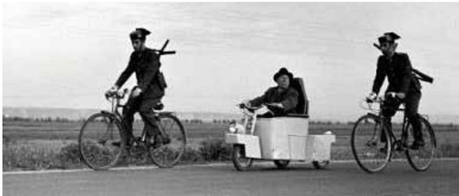
Fig. 13. El cochecito (Ferreri, 1960)