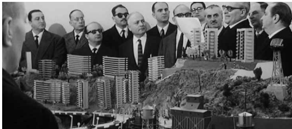
Fig. 10. Le mani sulla città (1963)

Per altre banda, Pier Paolo Pasolini, a La forma della città (1974), denigra dels edificis que destrueixen la forma donada antigament a la ciutat. La societat de consum ha fet el que no havia arribat a fer ni el feixisme.