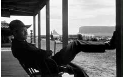
Fig. 8. My Darling Clementine (Ford, 1946)