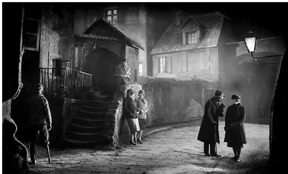
Fig. 1. La calle sin alegría (Pabst, 1925)

Les simfonies urbanes més destacades juguen en un espai entremig del realisme i l'avantguarda. Consideren, les seves obres, el cinema com l'art que millor pot registrar i mostrar la vida d'una ciutat. Perquè per a elles la ciutat és un organisme viu, que es desperta, treballa i, finalment, dorm. Característiques generals seves, són mostrar amb delit la força industrial concentrada,