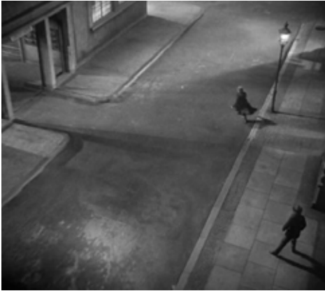
Fig. 11. M (Lang, 1931)