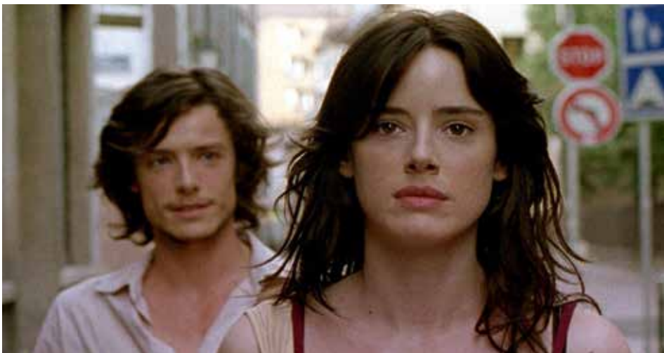
Fig. 15. En la ciutat de Sylvia (Guerín, 2007)

Ara que ja ens va quedant ben poc de la ciutat tal com l'hem viscut (pensem, sense anar més lluny, en el cas de Barcelona...), no ens resta més que la ciutat recordada, la somniada. Com la que era protagonista, junt a Sylvia, a En la ciutat de Sylvia (Guerín, 2007) (fig. 15). Cada un pot fer-se la seva. El mateix Guerín, fa poc, va comentar que havia tornat a Estrasburg, la ciutat on la va rodar: “No és ja el mateix”, va dir.