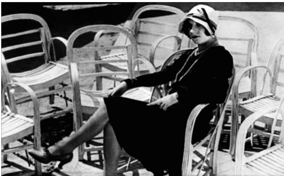
Fig. 3. À propos de Nice (Vigo, 1930)

Ladri di biciclette (De Sica, 1948) Miracolo a Milano (De Sica, 1951) (fig. 5) Umberto D (De Sica, 1952)