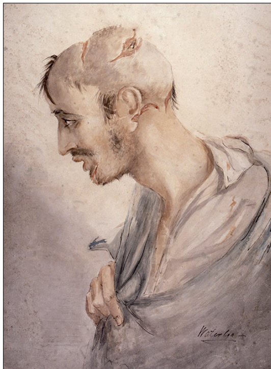
Figura 5. Soldat pintat de ferides a la cara i al cap, 1815. Pintura de Charles Bell.