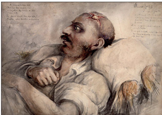
Figura 2. Soldat patint d'una ferida al cap, 1815. Pintura de Charles Bell.

17è regiment de peu). La bala més destructiva arrancava extremitats (la figura 3 representa un soldat anònim dels húsars Brunswick amb el braç esquerre emportat per un fragment de ferro d'un obús; la figura 4 representa un soldat anònim amb un braç arrancat per l'impacte d'una bala). Les llances o baionetes infligien ferides de perforacions profundes (la figura 5 representa una ferida de sabre a un membre de la tropa dels Royal Dragoons) mentre que els enormes forats eren causats per dispositius de bales arrencades en anells de ferro. 3