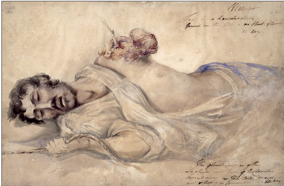
Figura 4. Soldat sense braç estirat, agafat a una corda, 1815. Pintura de Charles Bell.