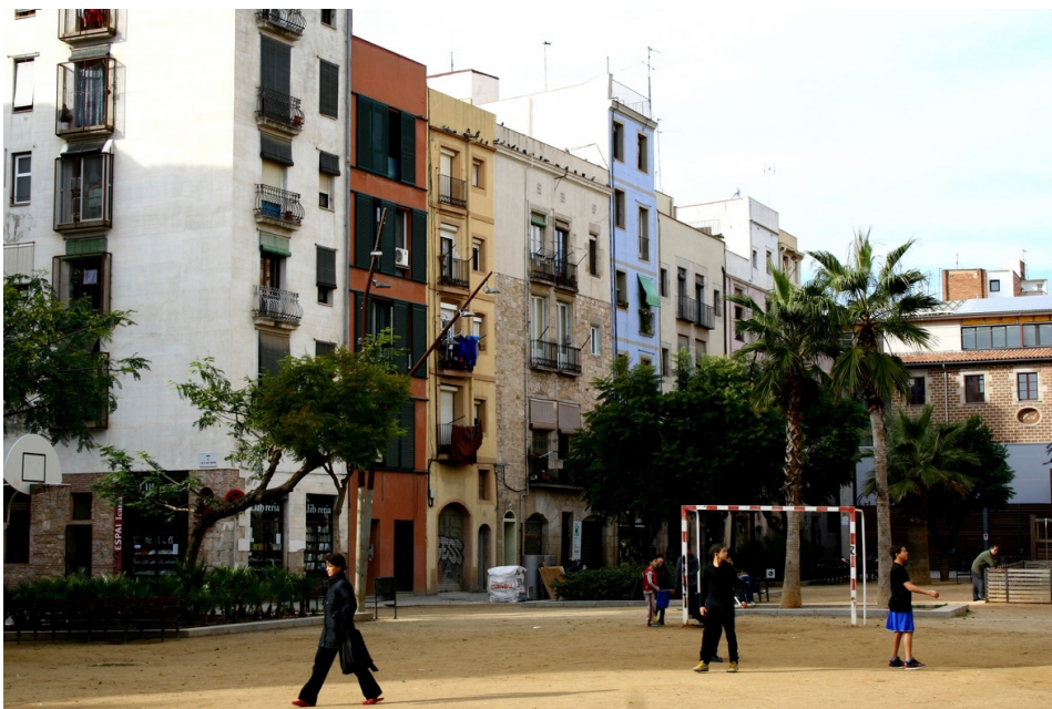
Figura 3. El Pou de la Figuera