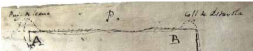
Figura 2. És gaire diferent un Coll d'un puig?

Fragment d'un croquis de 1774 amb les afrontacions d'una quadra o gran propietat, situada a cavall d'Olesa de Bonesvalls i Vallirana, amb el dibuix del perfil de l'anomenat Coll d'Estarola (el document també l'anomena Collbeix i Coll d'Ignarola) i del puig de Seana o Seïada (al document trobem les dues formes, l'actual és puig Saiada).