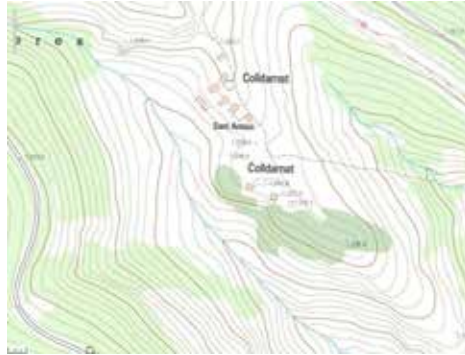
Figura 8. Colldarnat (la Vansa i Fórnols)

Un Coll sovint correspon també al replà d'una serra. Mapa: ICGC.