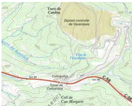
Figura 10. Collcardús

Collcardús ha esdevingut turó de Cardús. El nom antic perviu a la masia, que certament és en un coll 'modern'. Mapa: ICGC