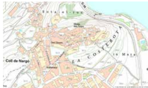
Figura 7. Coll de Nargó

El poble neix enlairat dalt d'un Coll, no a cap lloc de pas (el camí ral sempre ha estat a la vora del Seure). Mapa: ICGC