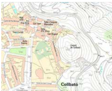
Figura 9. Collbató

Sembla clar que el topònim Collbató va designar primerament l'emplaçament del castell. Mapa: ICGC.