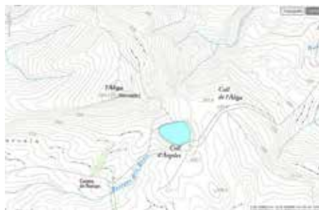
Figura 3. Coll de l'Àliga (el Pinell de Brai)

Coll de l'Àliga (límit entre el Pinell de Brai i Miravet), exemple de “depuració” cartogràfica dels topònims considerats dissonants. Del pic s'ha eliminat el genèric coll , i el topònim sencer s'ha traslladat al punt topogràficament més semblant al que és un coll en el català estàndard. Mapa: ICGC.