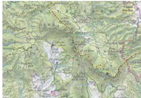
Serra de Cabrera és probablement una adaptació moderna del topònim Collsacabra .

La serra (el Coll) és l'element que presideix el paisatge de l'altiplà del Cabrerès. Mapa: ICGC