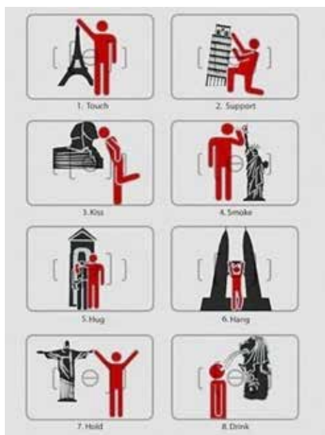
Figura 2. Manual de fotos turísticas. La profecía auto-realizada

http://www.democraticunderground.com/1018397902 [28 de octubre de 2013]