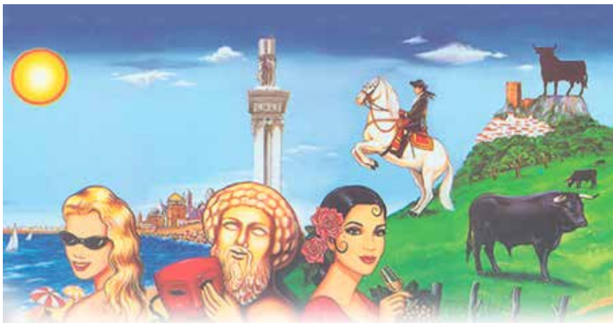
Figura 1. Imágenes estereotipadas constitutivas del imaginario andaluz

La cercanía gana a la distancia y el divorcio entre lo real y lo representado se hace patente. En este sentido el imaginario es nuestra ficción particular, es donde nos recreamos; es algo similar a lo que Žižek teoriza sobre los acontecimientos posmodernos que caracterizan lo contemporáneo: “Una ficción más real que la realidad misma”. 13 Al fin y al cabo “lo imaginario trata de dar consistencia a la realidad”, pues “la pulsión es lo real, y si entra en la representación es en la medida que imaginarizada” (Arroyo y Sádaba, 2012, p. 49-52). Según André Breton, imaginario es aquello que tiende a ser real (Naef, 2012).