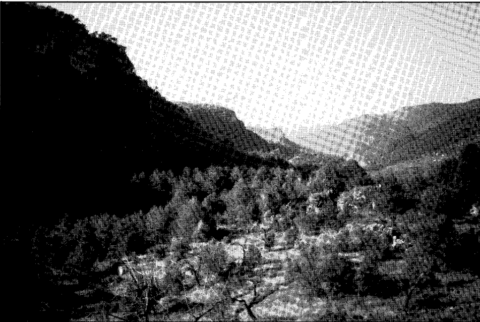
La Vall del Brugent: gradació de blaus i verds líquids...