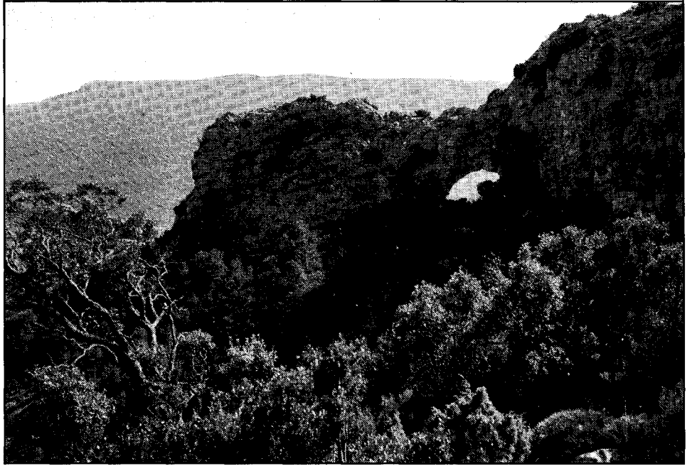
La roca Foradada, per on el vent hi tany la flauta...