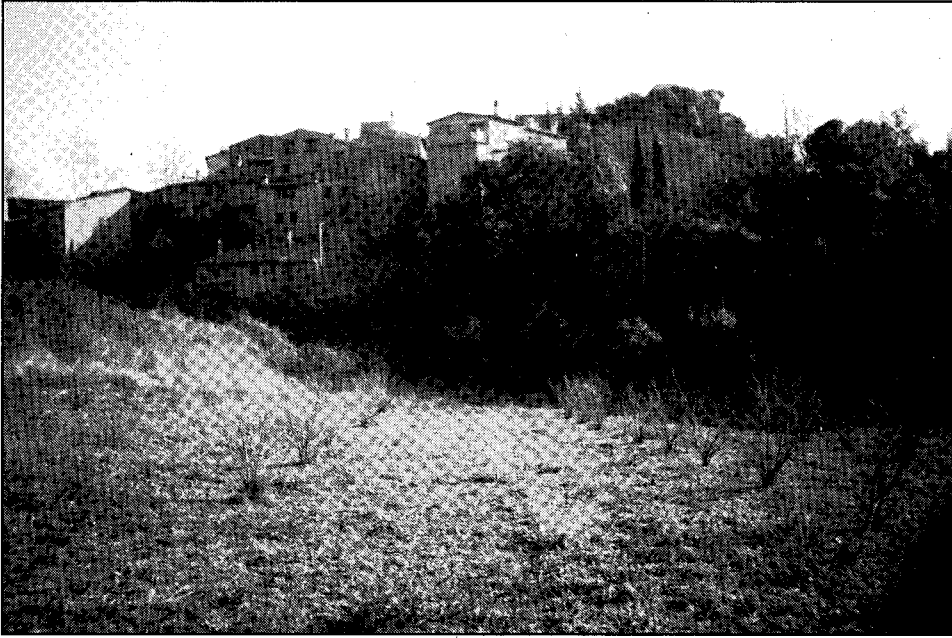
Farena, castell de pedra vora l'aigua vincladissa del Brugent...