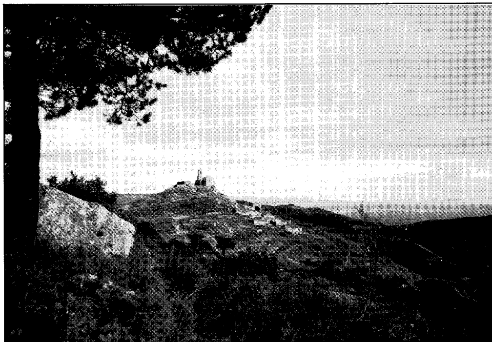
Mont-ral, arrapant-se a la terra i flairant els núvols...