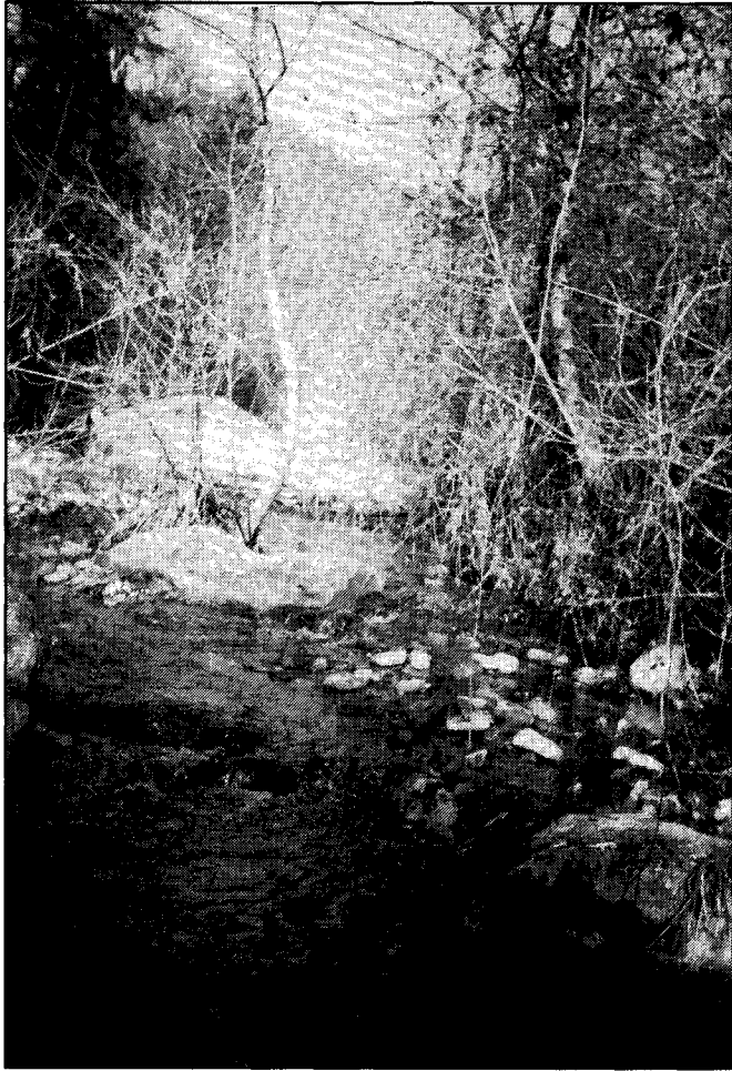
El riu Brunet, enfilant agulles de vegetació...