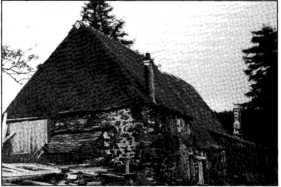
Fotografia 1. El mas de la Muntanya és construït amb materials del país: els gruixuts murs, de granit i basalt, i la inclinada coberta, amb ginesta.