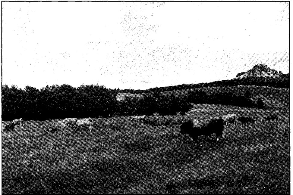
Fotografia 2. A l'estiu, els ramats de bovins pasturen pels prats de l'Altiplà de l'Ardecha, sota la presència vigilant dels sucs, que recorden l'origen volcànic de la regió.