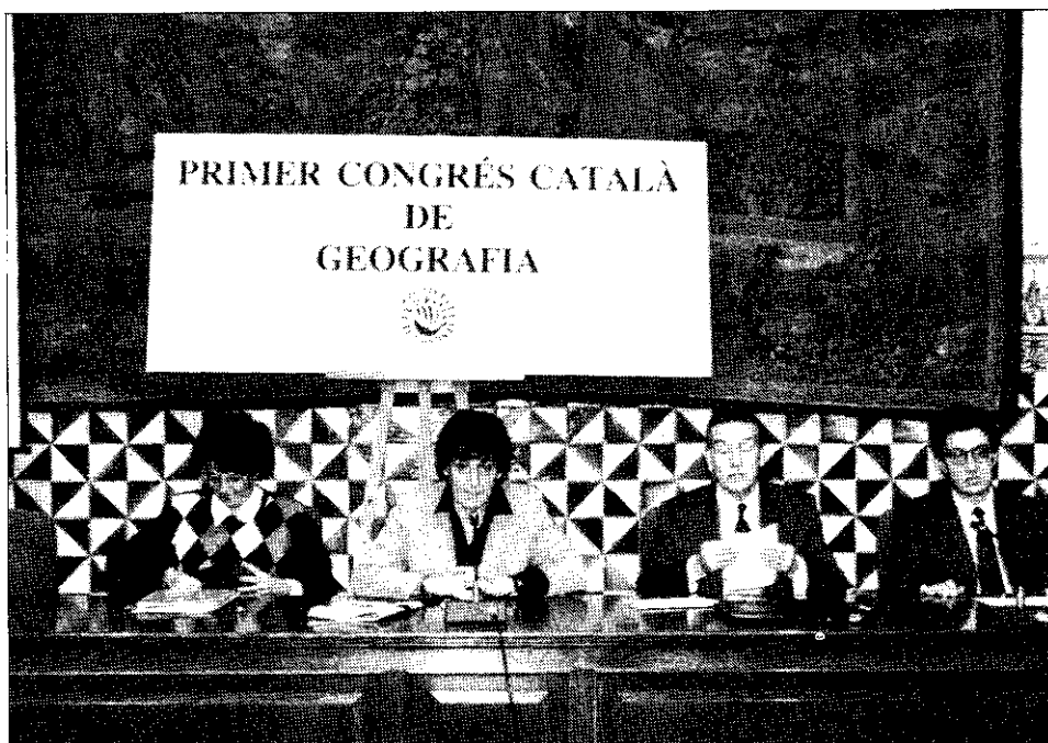
La presidència de la sessió primera.