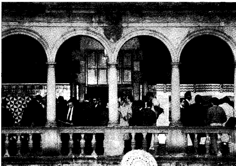
Els congressistes reunits al pati de l'IEC durant el Congrés.