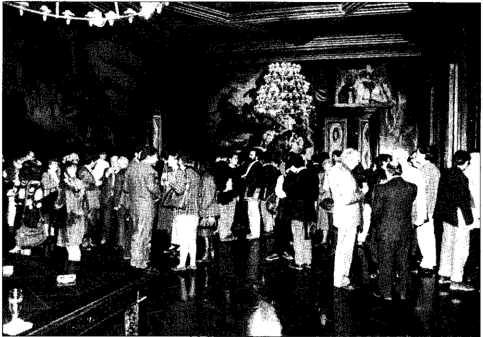
Una vista de la recepció al Saló de les Cròniques.