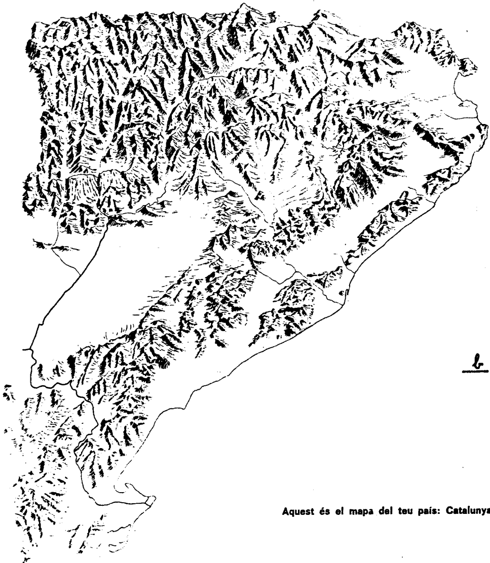
Aquest és el mapa del teu país: Catalunya

b) in BATLLORI, Roser; BENEJAM, Pilar; CASAS, Montserrat et al: Ciències Socials 5, Cicle Mitjà d'EGB , Barcelona: Editorial Casals, 1982. El diagrama es troba a la pàgina 3. Cartografia de Pau Alegre.