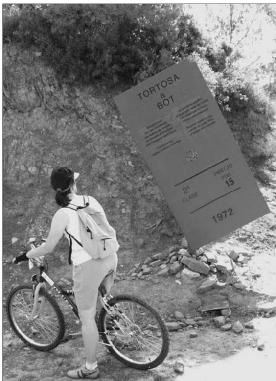
Bitllet de tren monumentalitzat, a Bot.