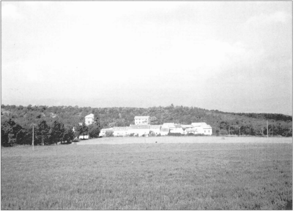
Vista de Vilalleons des del camí que puja a Puig-l'agulla. L'església de Santa Maria de Vilalleons fou incendiada pels francesos el 1654.