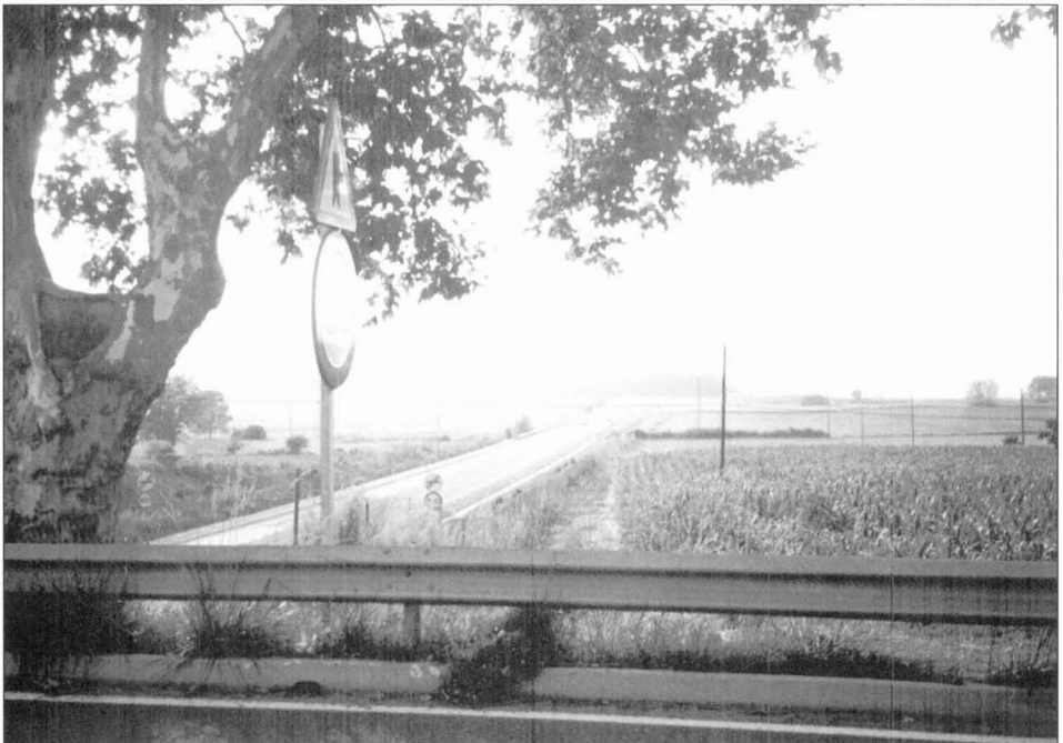
El pla de l'Aviació és una planícia on es construí una petita pista d'atterratge durant la Guerra Civil.