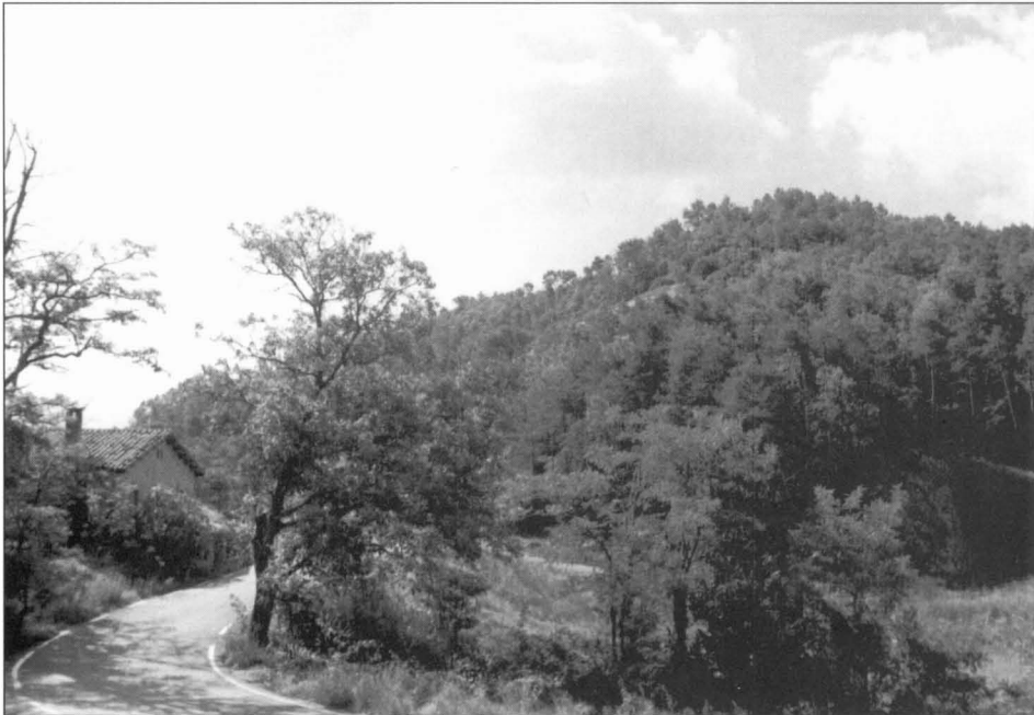
El puig Moltó és una elevació que ratlla el 800 metres d'altitud. Entre ella i la Casilla de Romegats trobem l'Eix Transversal.