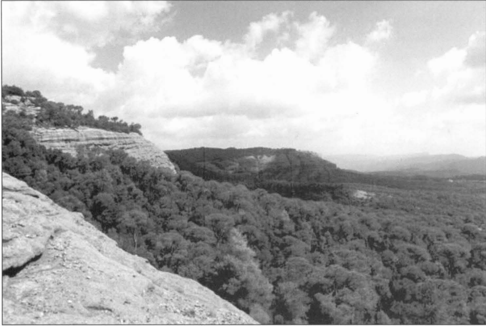
El cingle de Romegats, a l'est del terme de Sant Julià de Vilatorrada, és un espadat que arriba en algun punt als cent metres de desnivell.