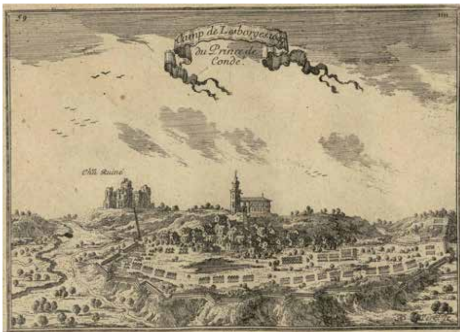
Figura 6. Camp de Lesborges. 1647

Dins Beaulieu (segona meitat XVII) Les plans et profils des principales villes et lieux considerables de la principauté de Catalogne avec la carte generale et les particulieres de chaque gouvernement.