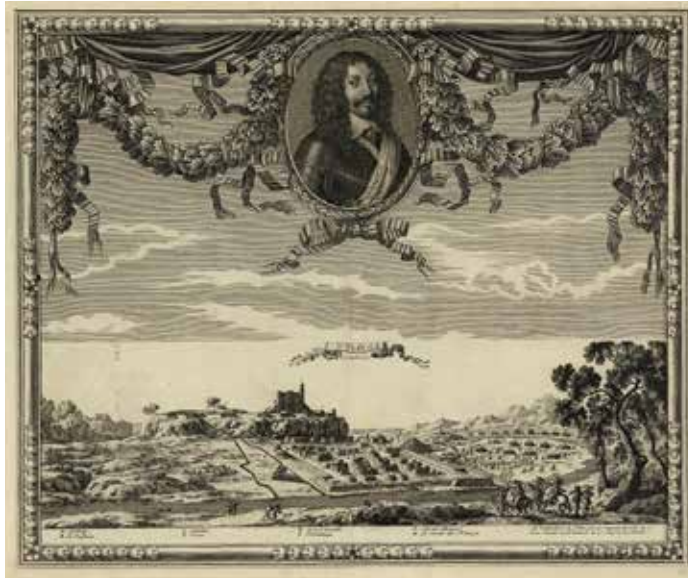
Figura 7. Flix en Catalogne

Dins Beaulieu (finals del segle XVII, principis del XVIII) Les glorieuses conquestes de Louis le Grand roy de France et de Navarre dédiées au roy.