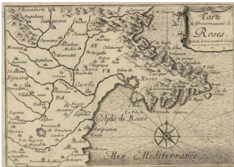
Figura 4. Carte de Gouvernement de Roses

Dins Beaulieu (segona meitat XVII) Les plans et profils des principales villes et lieux considerables de la principauté de Catalogne avec la carte generale et les particulieres de chaque gouvernement.