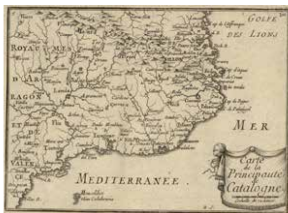
Figura 3. Carte de la Principauté de Catalogne

Dins Beaulieu (segona meitat XVII) Les plans et profils des principales villes et lieux considerables de la principauté de Catalogne avec la carte generale et les particulieres de chaque gouvernement.