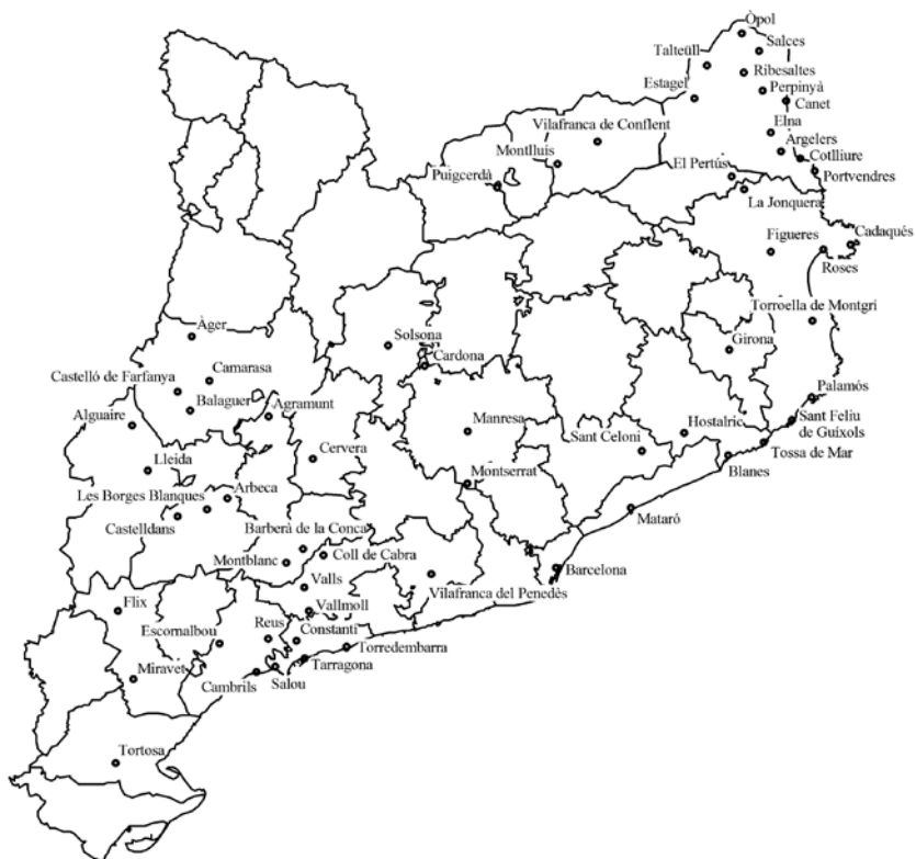
Figura 2. Llocs representats als Petit Beaulieu

Elaboració pròpia. Font: Pastoureau (1984)