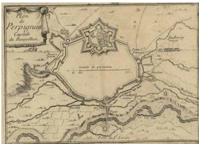
Figura 5. Plan de Perpignan

Dins Beaulieu (segona meitat XVII) Les plans et profils des principales villes et lieux considerables de la principauté de Catalogne avec la carte generale et les particulieres de chaque gouvernement.