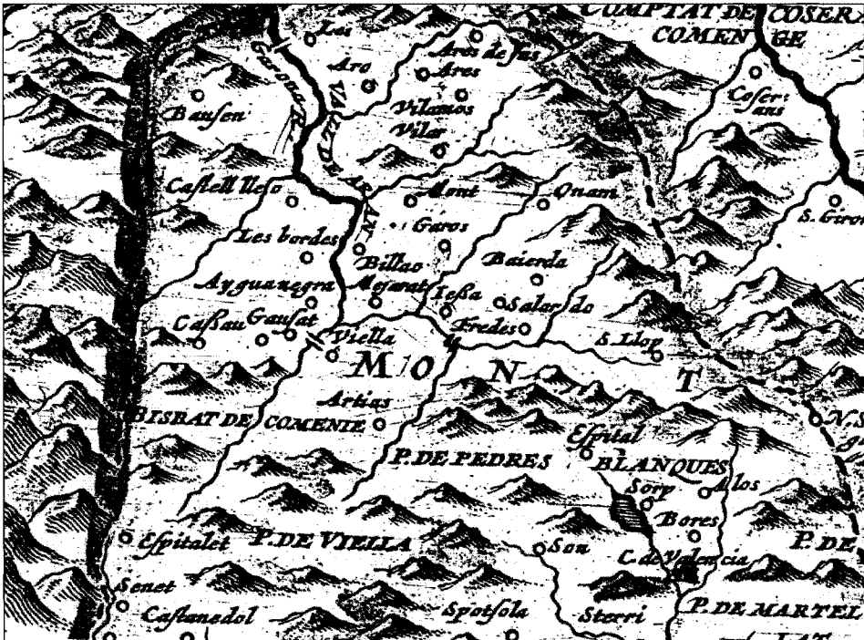
Figura 1 Mapa de Van Lochom (1642)