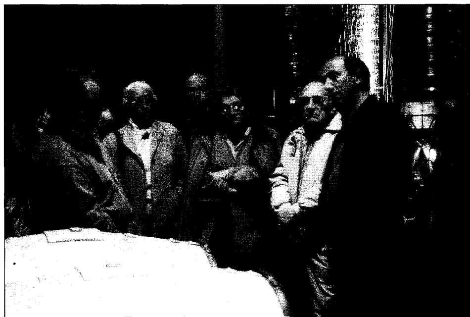
Visita al celler Clos de l'Obac.