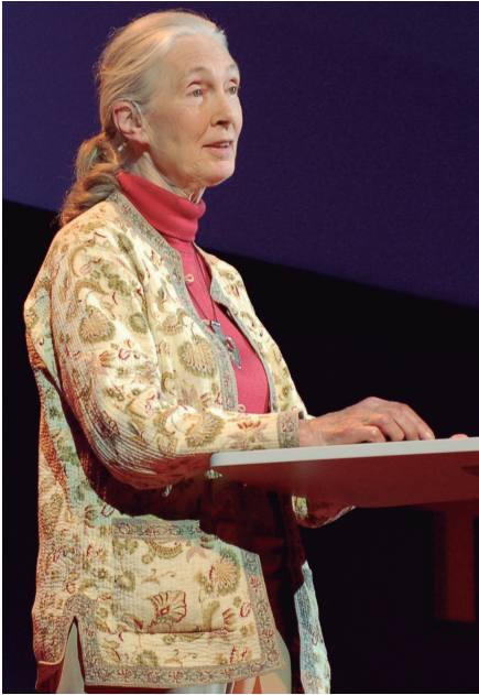
..... † Figura 3. Jane Goodall. .....

això va ser una de les claus per a descobrir nous patrons de comportament dels primats. Jane Goodall (figura 3), per exemple, estableix la idea que cada individu és interessant per si mateix, i que les femelles no eren un recurs més en societats dirigides pels mascles, sinó que les femelles lluitaven per mantenir les seves jerarquies dins del grup, caçaven i busquen activament les seves parelles sexuals. Així doncs, la primatologia és un exemple de com una ciència androcèntrica pot fer un gir cap a una ciència més ginocèntrica o, almenys, més igualitària, que a més pot tenir efectes directes en la cultura i el comportament humà, ja que l'estudi dels primats sempre s'ha utilitzat per a intentar entendre l'espècie humana (Saura Mas, 2021a).