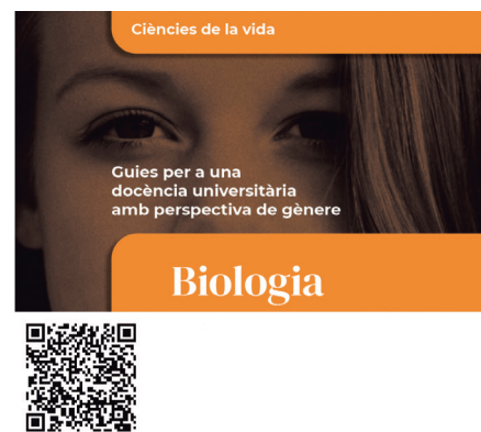
↑ Figura 5. Coberta i QR de Biologia: Guies per a una docència universitària amb perspectiva de gènere (en línia), de Sandra Saura Mas, publicat per la Xarxa Vives d'Universitats l'any 2021, < https://www.vives.org/book/biologia-guies-per-a-una-docencia-universitaria-amb-perspectiva-de-genero/ > (consulta: setembre 2022).

Són moltes les propostes i les accions que es poden fer per a superar l'androcentrisme en la ciència, i són molts els autors i les autores que han escrit i han aportat idees i recursos per a caminar i actuar per la transformació cap a unes ciències biològiques més igualitàries. En aquest