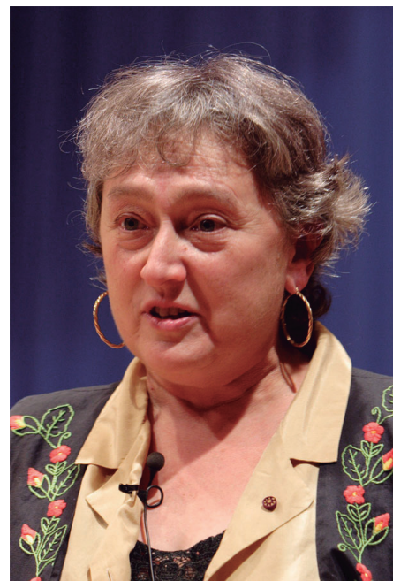
↑ Figura 2. Lynn Margulis.

La primatologia és una disciplina en què des dels anys seixanta han destacat els noms de dones com Jane Goodall, Biruté Galdikas o Dian Fossey. Les primeres observacions dels primats, concretament en babuïns, fetes per homes, descrivien i posaven el focus principalment en les relacions d'aquests individus, que descrivien com a molt militaritzades, basades en la lluita i el poder, amb la qual cosa van interpretar la lluita com la clau per a sobreviure i mantenir els estatus socials dins dels grups (Saura Mas, 2021a). En canvi, quan les dones van entrar a estudiar la primatologia, per cert, una de les disciplines de la biologia en què ressalten més noms de dones, tot i haver-hi també molts homes, es van començar a descriure patrons que no s'havien descrit fins llavors (Martínez Pulido, 2014). Es va començar a fer una observació més sistemàtica de tots els individus i no només dels més vistosos o agressius, i