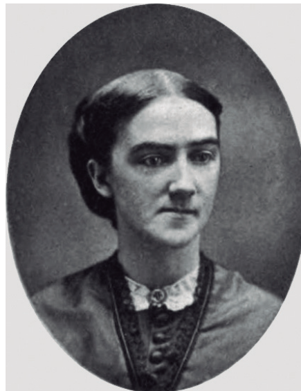
..... † Figura 4. Ellen Swallow Richards. .....

ció d'aquest terme, en realitat, hi podria haver destacat el nom d'una dona: Ellen Swallow, química ambiental acceptada al departament de química del Massachusetts Institute of Technology (MIT) (figura 4) i contemporània d'Ernst Haeckel. Ellen Swallow concebia el terme ecologia focalitzat en els humans i les condicions ambientals creades pels humans (Saura Mas, 2021b). També centrava l'atenció en les conseqüències que tenia sobre la salut de les persones viure en aquelles condicions (Dyball i Carlsson, 2017). Concretament, va definir l' ecologia com un concepte molt lligat a les persones: «la ciència de les condicions de salut i benestar de la vida humana diària» (Dyball i Carlsson, 2017). A la biografia escrita per Pamela Swallow (2014) es descriu com Ellen Swallow fins i tot va escriure a Ernst Haeckel per demanar-li permís per a usar el terme i ell li va concedir. L'any 1892 el terme oekologia , sense un ús definit per Ernst Haeckel, prenia una nova forma gràcies a la nova definició d'Ellen Swallow: la ciència de les condicions socials i ambientals quotidianes propícies per al benestar humà (Swallow, 2014). Tot i això, no havia passat ni un any quan el 1893 el British Medical Journal ja va reivindicar el terme oekologia i s'acceptà com «l'exploració dels interminables fenòmens de la vida animal i vegetal tal com es manifesten