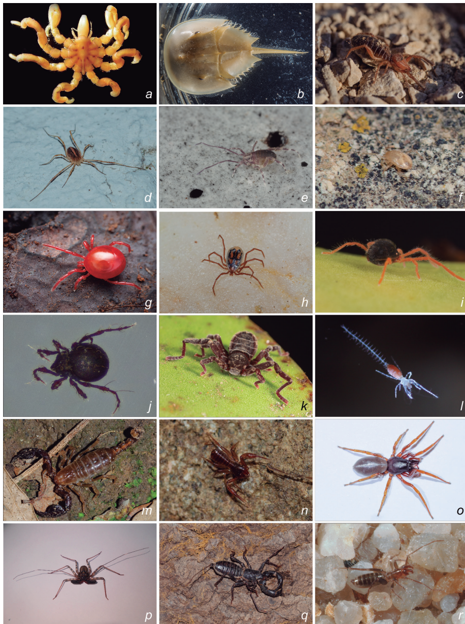
† Figura 2. Fotografies dels ordres de quelicerats: a) Pycnogonida; b) Xiphosura, Limulus polyphemus juvenil; c) Solifugae, Gluvia dorsalis ; d) Opiliones, Odiellus cf. troguloides ; e) Opilioacarida, Opilioacarus baeticus ; f) Mesostigmata sp.; g) Holothryda; h) Ixodida, Ixodes vespertilionis ; i) Trombidiformes, Penthaleidae sp.; j) Sarcoptiformes, Damaeus onustus ; k) Ricinulei, Cryptocellus sp.; l) Palpigradi, Eukoenia strinatii ; m) Scorpiones, Belisarius xambeui ; n) Pseudoscorpiones, Chthoniidae sp.; o) Araneae, Dysdera catalonica ; p) Amblypygi, Damon diadema ; q) Uropygi, Mastigoproctus giganteus ; r) Schizomida, Stenochrus portoricensis .

amb funció alimentària, anomenats quelicers . Aquest grup el coneixem com a quelicerats .