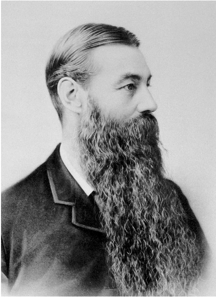
† Figura 3. Conwy Lloyd Morgan (1852-1936)......

mètodes rigorosos a l'estudi de la psicologia comparada. Per tal d'evitar errors en la interpretació del comportament animal, va proposar el principi conegut com a «cànon de Morgan», publicat a la seva Introduction to Comparative Psychology (1894). Els humans tendim a atribuir estats mentals, pensaments, sentiments i intencions a altres éssers humans. Actualment, aquesta capacitat s'anomena Teoria de la Ment (Premack i Woodruff, 1978), i es considera que té un gran valor adaptatiu en permetre'ns predir el comportament dels altres i actuar en conseqüència. No obstant això, aquesta tendència a mentalitzar les accions d'altres no se circumscriu als individus de la nostra espècie, sinó que l'apliquem a altres éssers vius o, fins i tot, a objectes inanimats. El problema és que ens pot portar a atribuir als animals capacitats que no posseeixen. Aquest error es denomina antropomorfisme i és el que el cànon de Morgan pretén evitar amb l'aplicació del principi que no s'ha d'interpretar una acció com el resultat d'una facultat psíquica superior, si pot interpretar-se com a resultat d'una de més baixa en l'escala psicològica. Encara que Morgan accepta que tots els éssers vius estan relacionats genealògicament, considera que no es poden obviar les diferències que separen els éssers humans de la resta de la natura. En una branca d'un arbre filogenètic poden aparèixer novetats que no