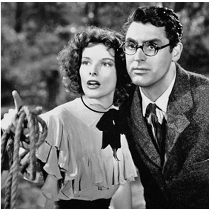
† Figura 1. Fotograma de la pel·lícula Bringing up baby (Howard Hawks, 1938) amb Katharine Hepburn i Cary Grant. Imatge de domini públic.

La paleontologia, com totes les disciplines naturalístiques, va tenir una primera fase de desenvolupament (durant els segles XVIII i XIX) en la qual classificar, descriure, catalogar eren feines peremptòries per organitzar la informació existent. Però durant el segle XX, moltes disciplines naturalístiques van sortir d'aquest encapsulament tipològic per abra-