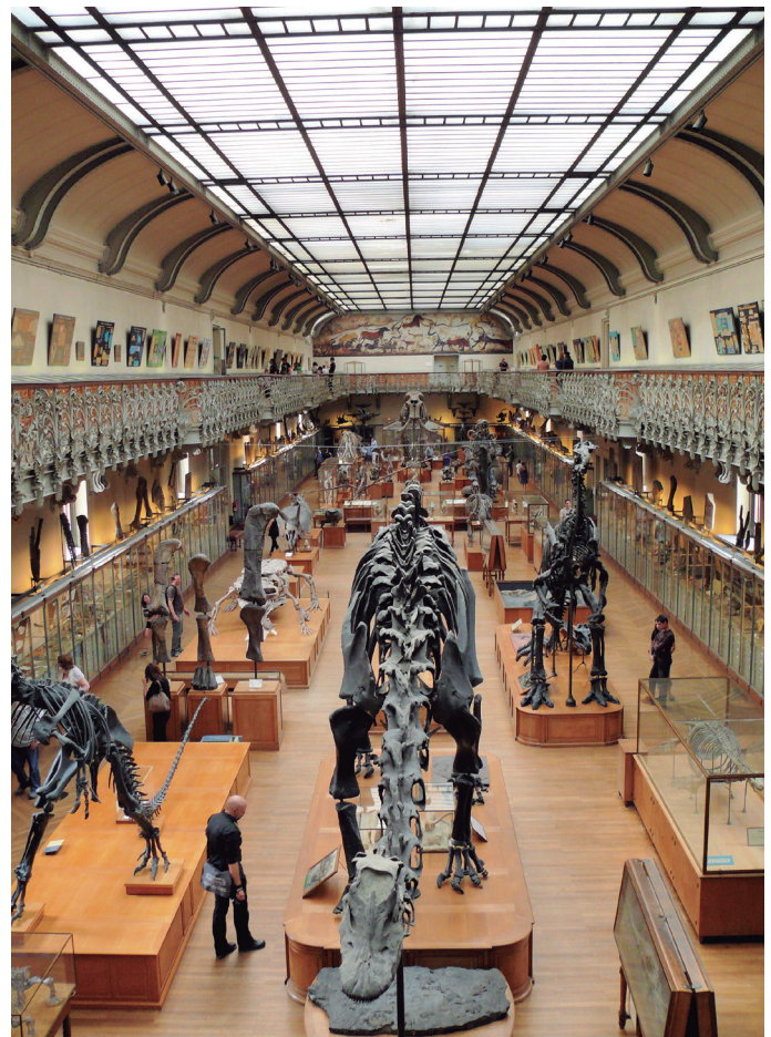
† Figura 2. Galeria de paleontologia i anatomia comparada del Muséum d'histoire naturelle de París, fundat el 1793. La imatge il·lustra perfectament la visió dominant de la paleontologia (i la zoologia) durant els darrers segles. Imatge de domini públic.