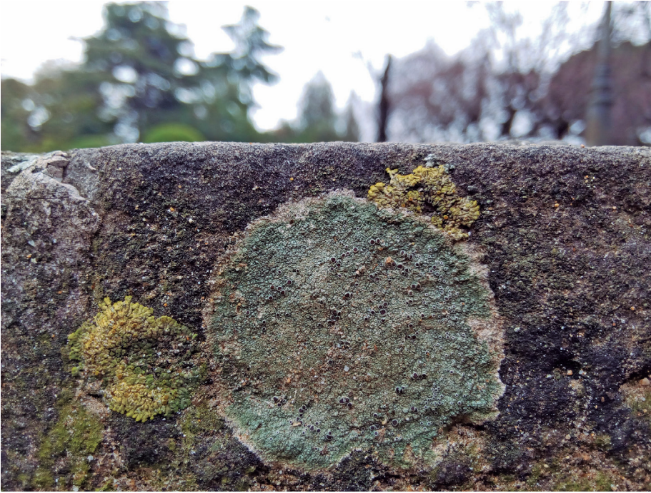
↑ Figura 2. Lecanora campestris a les escales dels jardins del Palau de Pedralbes.

dels quals hem advertit també els riscos socioculturals a què sotmetem els líquens en superfícies com teules, baranes i d'altres elements arquitectònics. Revertir la idea que fan brut, quan en realitat són la «pell» que protegeix els monuments o el descans dels nostres morts, i emfatitzar el valor d'aquesta biodiversitat, ha esdevingut alhora un dels nostres objectius, més enllà de quedar-nos tan sols amb el potencial dels epífits per parlar-nos de la qualitat atmosfèrica.