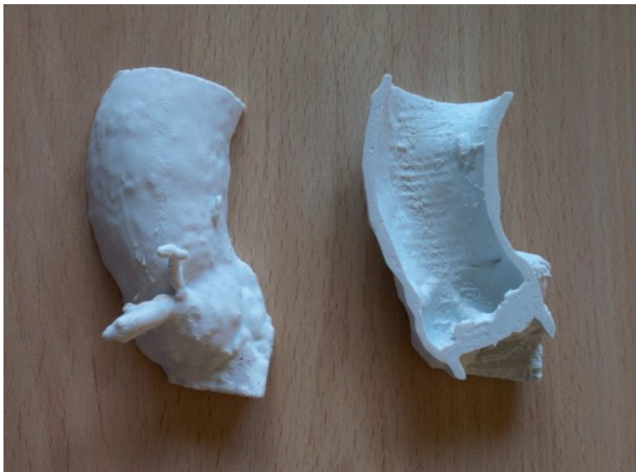
† Figura 1. Impressió 3D d'un model de tronc d'aorta, tallat transversalment, extret d'imatges CT. El material emprat és PLA o àcid polilàctic.

nir una visualització del resultat abans de la intervenció per poder triar la pròtesi del mercat més adequada donades les característiques de l'anatomia. Actualment hi ha diversos models de pròtesi de vàlvula aòrtica per a procediments TAVI, i de cada model, hi ha diverses mides disponibles. En concret, en aquest estudi es va treballar amb el model Edwards-Sapien XT (Edwards Lifesciences, Irvine, Califòrnia, EUA), ja que és l'utilitzat a l'Hospital Clínic.