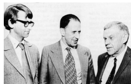
↑ Figura 2. Els tres guardonats en la primera edició del Premi Huntsman, 1980. D'esquerra a dreta: Dan P. McKenzie, Ramon Margalef i Henry M. Stommel.