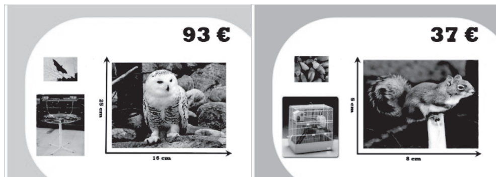
FIGURES 2 I 3 Prova conversacional