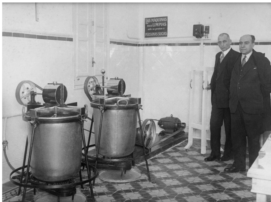
La primera fàbrica.