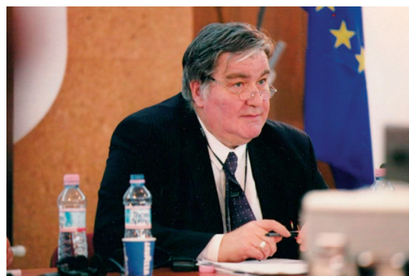
Figura 3. Comissió Europea - DG Mercat Interior, Brussel·les.

ció i l'Agricultura (FAO). Només dir-los que deixava l'Associació ja em van fer membre d'honor i poc temps després, fins allà, a Roma, van venir a passar uns dies de vacances la presidenta i algunes amigues i col·legues. Recordo aquells dies a Roma amb totes aquelles senyores professores d'universitat com una gran celebració, perquè van ser quatre dies de visitar les gelateries i trattories més divertides i riure i fer broma (res a veure amb la bromatologia) sense descans.