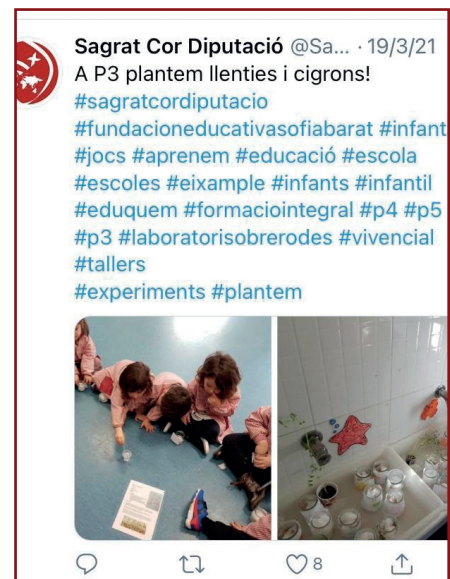
Figura 5. Divulgació a les xarxes de la pràctica en l'etapa de P3.