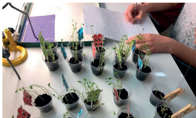
Figura 1. Realització de la pràctica pels alumnes de 1r d'ESO.

Execució: s'elabora un vídeo en el qual els alumnes expliquen tot el procediment per a la realització de la pràctica. Es fa en un format que es pugui guardar en un llaç digital, ja que aquest mecanisme de memòria serà part del material que anirà dins la caixa del «Laboratori sobre rodes».