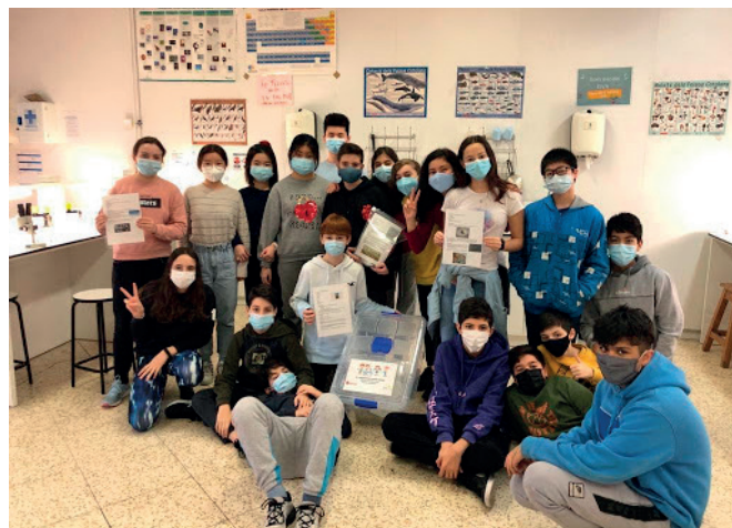
Figura 6. Classe de 1r d'ESO C, encarregats de l'elaboració del «Laboratori sobre rodes» per a l'etapa d'infantil.

DEPARTAMENT D'ENSENYAMENT (2014). Competències bàsiques de l'àmbit