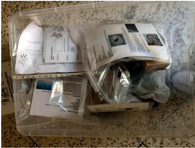
Figura 2. Material de les pràctiques del «Laboratori sobre rodes».

El fet d'oferir la pràctica en format també digital ajuda a contextualitzar millor el que faran els alumnes d'altres etapes i alhora donar-los la benvinguda a aquest projecte per part dels alumnes que els faran tota l'explicació.