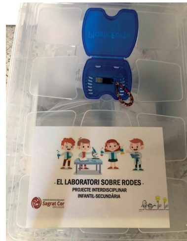
Figura 3. Tàper del «Laboratori sobre rodes».

Alhora es demana als professors de l'etapa en la qual es realitzarà el «Laboratori sobre rodes» que pengin una notícia a les xarxes de l'escola.