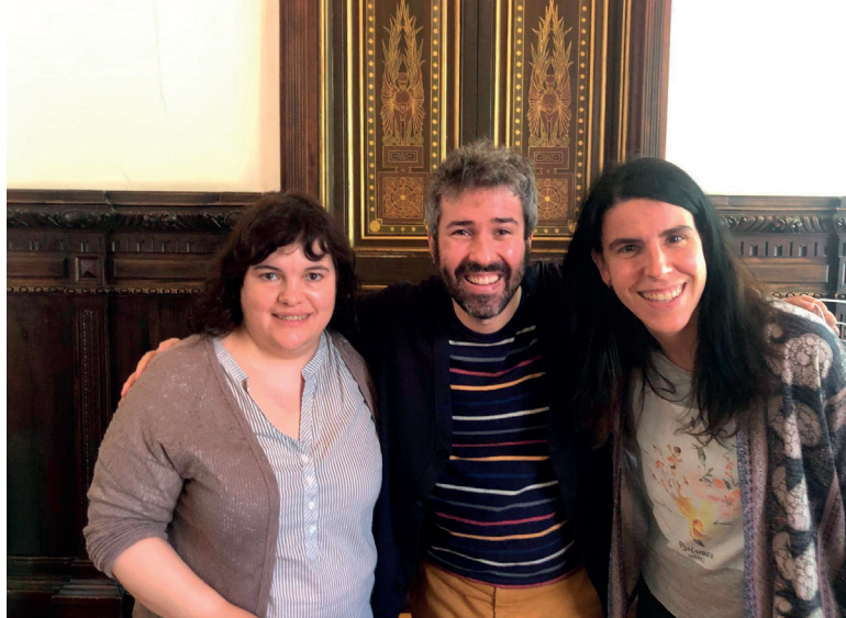
Equip d'innovació de l'Escola Sagrat Cor Diputació.