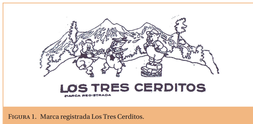
FIGURA 1. Marca registrada Los Tres Cerditos.

Des d'una perspectiva actual, aprofundint en què va impel·lir els joves empresaris a voler adoptar aquest nom com a marca amb una caràtula de muntanyes i tres porquets al davant vestits com al film i acompanyats de diferents instruments: una flauta, un violí i a sobre d'un totxo amb eines de paleta el tercer, fa pensar, en primer lloc, en una