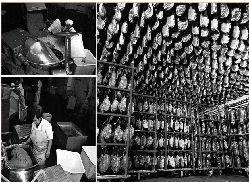
FIGURA 4. Nau d'assecatge i de curació de diferents productes: pernil, cansalada viada, xoriç, llonganissa. Procés de trinxat i de pastat al buit de la carn.

La descripció ens permet conèixer l'equipament de la nova fàbrica amb la maquinària i les seves instal·lacions especials i necessàries, com ara muntacàrregues, aigua calenta, instal·lació elèctrica i de força, els fluorescents i el quadre de comandaments, amb un valor de 350.000 pessetes (figura 4). Estava considerada entre les empreses que consumien 112 quilowatts. També una picadora de carn amb un electromotor de 2 hp valorada en 23.000 pessetes; una picadora de carn amb electromotor de 3 hp valorada en 28.000 pessetes; una talladora de carn tipus Cutter amb electromotor de 20 hp valorada en 160.000 pessetes; una pastadora al buit amb electromotors de 3 1/2 i 1 hp, respectivament, valorada en 120.000 pessetes; una pastadora al buit amb electromotors de 5 1/2 i 2 hp, respectivament, valorada en 169.000 pessetes; una embotidora amb electromotor de 3 hp valorada en 42.000 pessetes; una embotidora automàtica amb electromotor de 20 hp valorada en 210.000 pessetes; una talladora de carn en llenques amb electromotor de 4 hp valorada en 30.000 pessetes; una màquina d'esclovellar amb electromotor de 2,5 hp