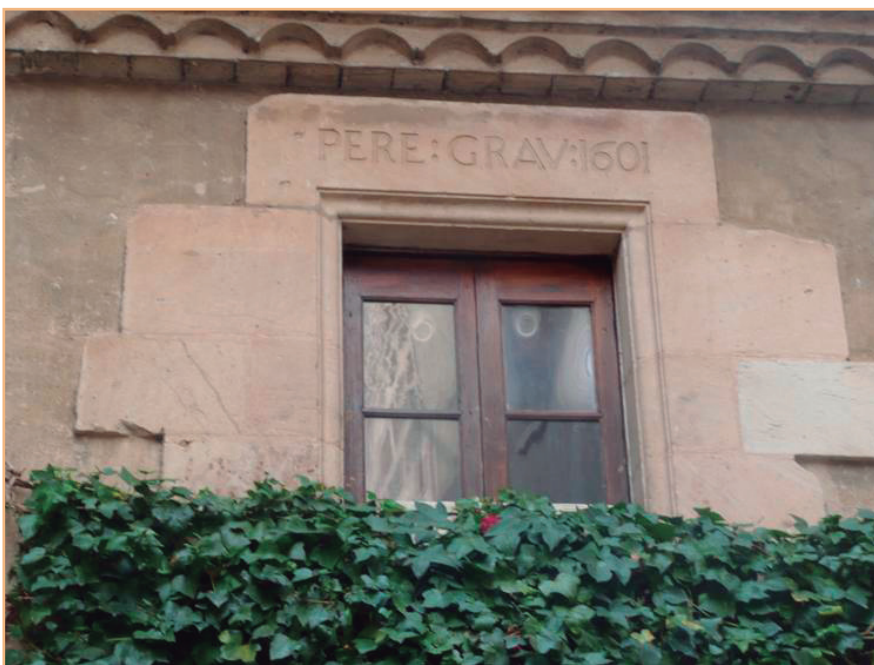
FIGURA 1. L'edifici.

Sanmartí, llavors, va inventar un artefacte de fusta, semblant a una