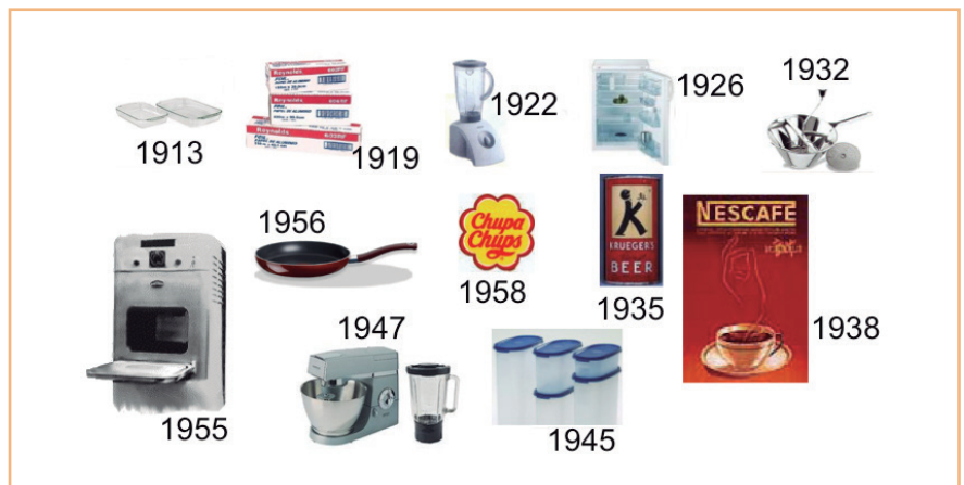
FIGURA 3. Noves tecnologies del segle xx.

Hi ha dos conceptes que van sorgir i giren al voltant dels preceptes indicats. Així, es pot anomenar la impresió 3D que, tot i no complir, ara, paràmetres com els d'aparell barat i ràpid, a mesura que ens endinsarem en el segle XXI el mateix desenvolupa-