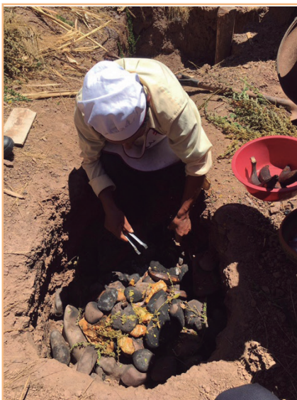
FIGURA 1. Coccions sota terra, el pachamanca , Perú.

Si ens continuem centrant en els aparells de cocció i específicament en els forns, en l'antigor, ja els egipcis i babilonis cuinaven en forn de