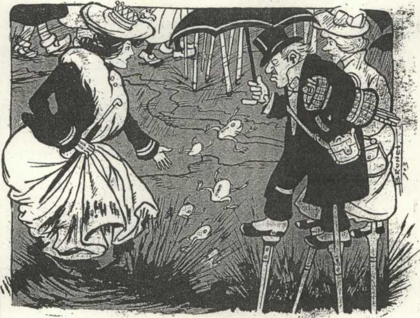
!!! Aixó es Barcelonalll