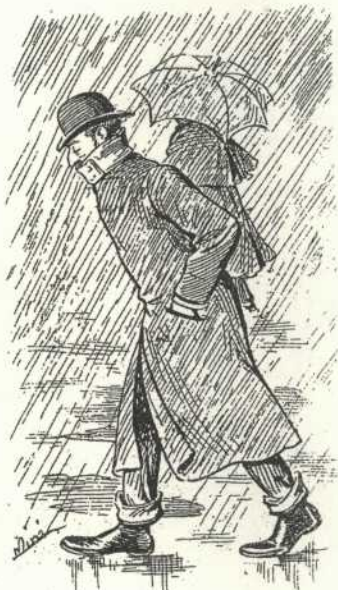
Quan cauen quatre gotes.