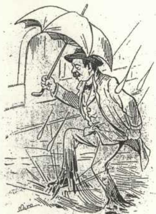
Quan no cauen vuyt.