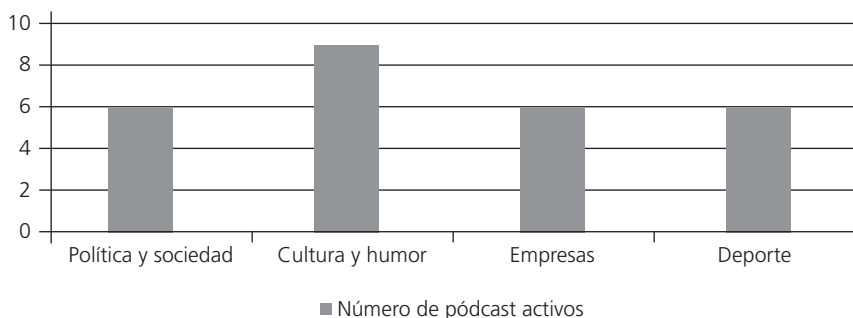
Gráfico 1. Número de pódcast activos en Plaza Radio divididos por temáticas tratadas

Además, los géneros a través de los cuales se tratan estas temáticas también son variados, con un modelo radiofónico que no aspira a competir con el propio diario al que pertenece por la primicia, sino que trata los temas de la actualidad de