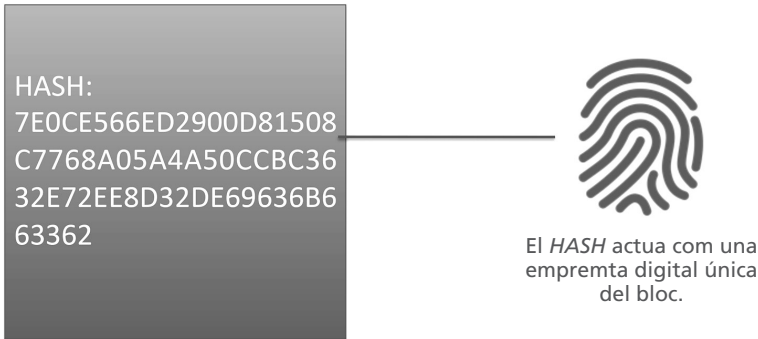
Figura 3. Configuració d'un hash (ID d'un bloc de la blockchain )

o de persones diferents. Això pot augmentar els costos i comprometre l'anàlisi de la informació recopilada.