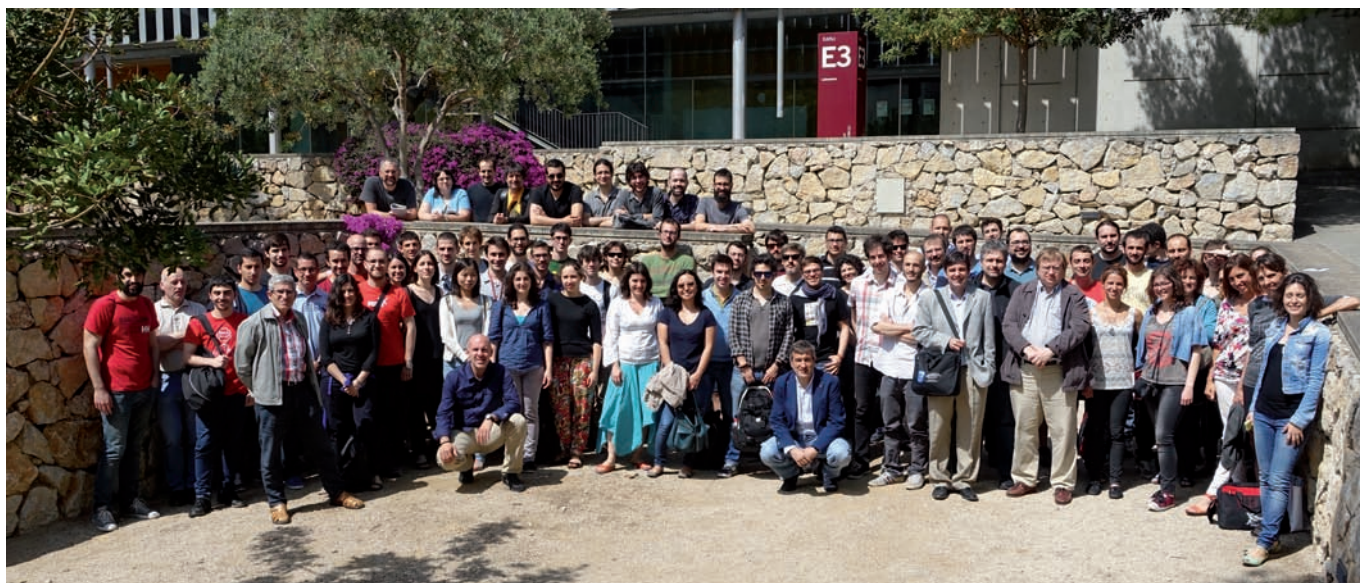
Figura 1: Mostra dels participants a la IV Jornada complexitat.CAT, que va tenir lloc el maig de 2015 a Tarragona, al campus de la URV.

objectiu va ser tenir una web on es recol·lectessin tots els esdeveniments relacionats amb els sistemes complexos a Catalunya (seminaris, tesis doctorals, congressos, beques), i el següent va ser incentivar i organitzar activitats pròpies.