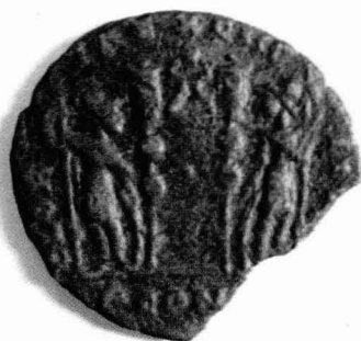
Tav. XI - Moneta di età romana del 330-335 d.C. Probabile autorità emittente Costantius Caesar; Aes gr. 2,18; mm. 18; solcatura sul D/.

D/: busto diadematato, drappeggiato e corazzato a d.