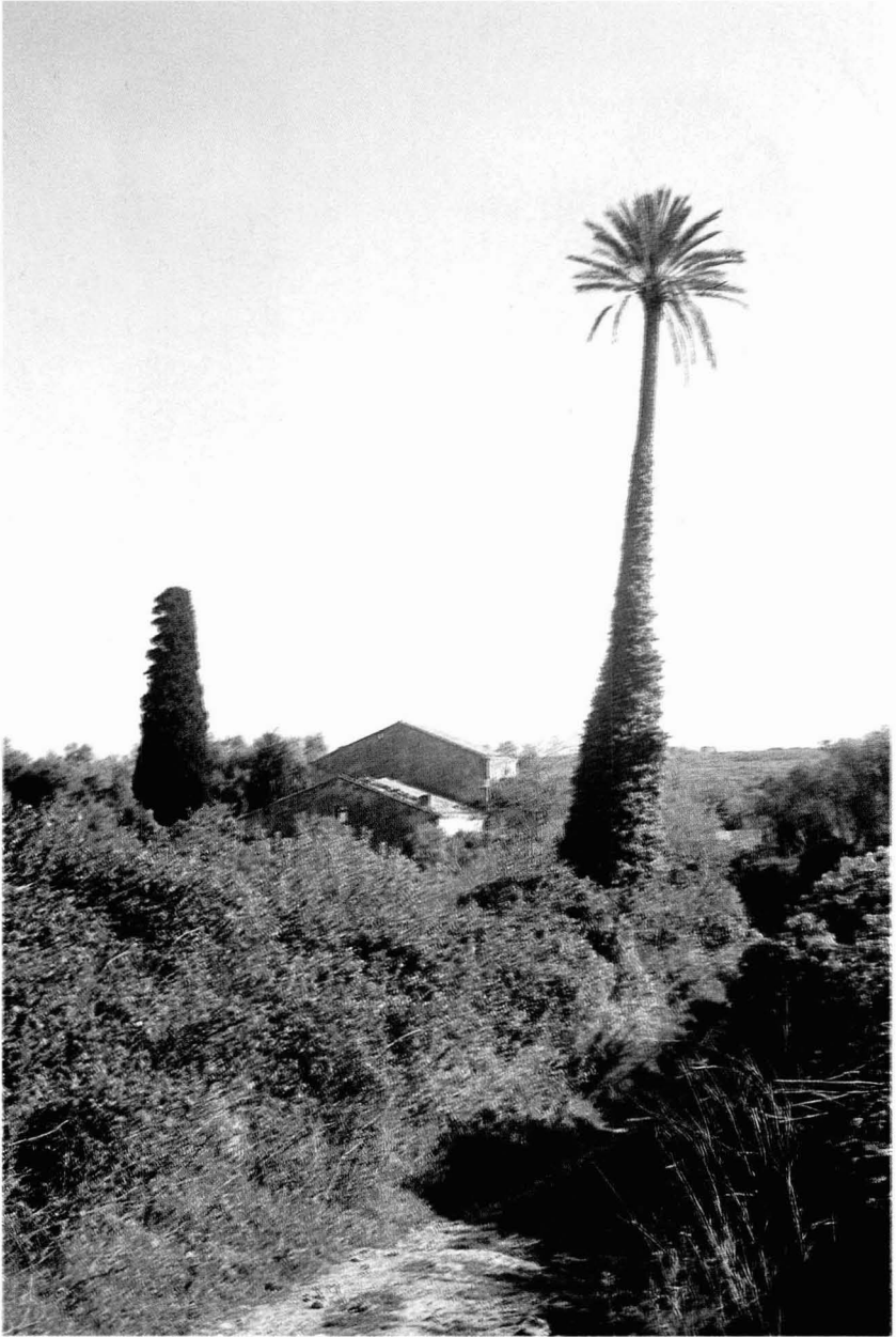
Tav. XII - La palma secolare fa da sfondo al sentiero che attraversa l'ambiente termale romano di Corax , di cui sono state rilevate tracce di suspensure che reggevano la pavimentazione del "caldarium" (sala destinata ai bagni caldi).