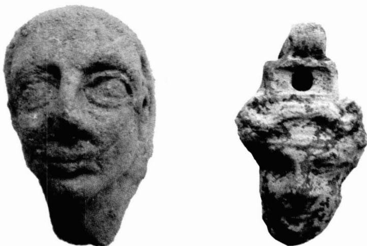
Tav. IX - Maschere fittili, anch'esse ex-voto, rinvenute all'interno delle vasche e del pozzo sacro venerato dalle popolazioni nuragiche e post-nuragiche, come un santuario dei nostri giorni.