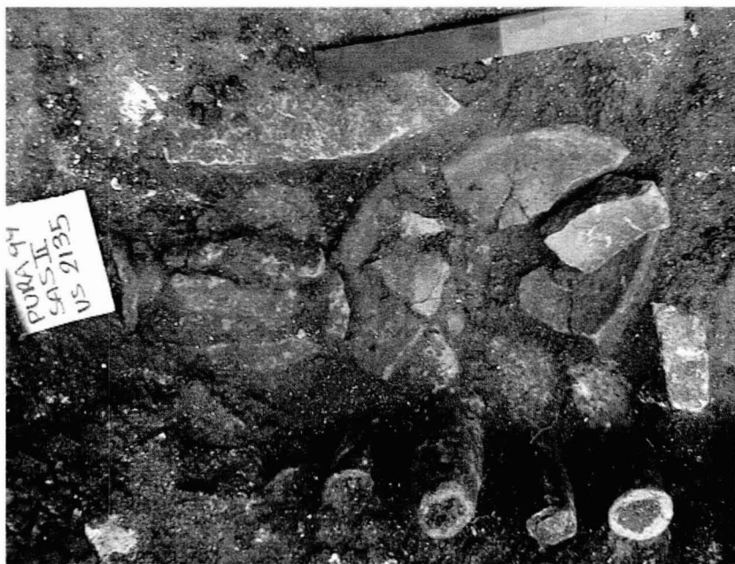
Tav. VIII - Altro materiale fittile emerso negli scavi effettuati nella seconda vasca: sono visibili alcuni ex-voto raffiguranti gli arti inferiori oggetto del "miracolo".