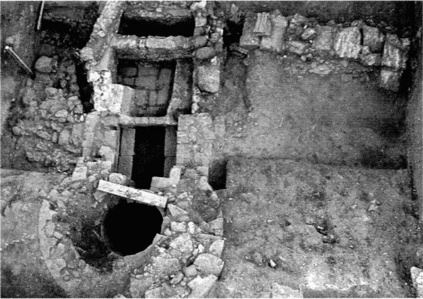
Tav. VI - Il pozzo sacro di età nuragica e le vasche adiacenti di età romana di Corax , alimentate da un sistema di canalizzazione ancora da portare alla luce, orientato verso l'impianto termale.