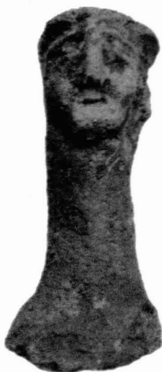
Tav. X - Altri ex-voto fittili raffiguranti il primo una maschera, parzialmente ricomposta, in origine spezzata in funzione del rito; il secondo un dito antropomorfo.