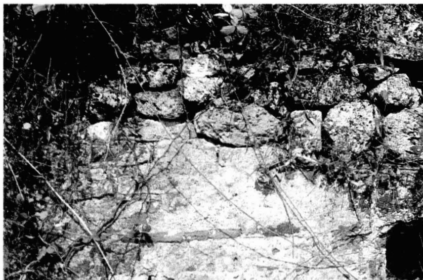
Tav. V - Resti della struttura termale situati lungo il sentiero che porta a Monte Carru , a pressoché uguale distanza dall'impianto nuragico e dal pozzo sacro di Corax .