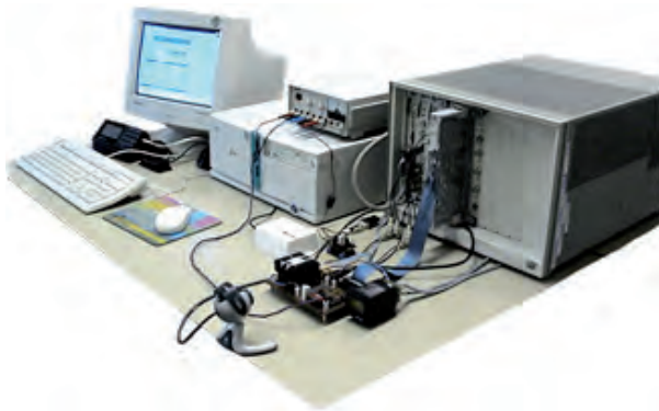
FIGURA 2. Laboratori remot VirtualLab basat en un instrument modular VXI.

va formar el Grup d'Interès Laboratoris Virtuals i Remots (GiLABViR; Cabrera et al. , 2010a), amb l'objectiu de reunir les iniciatives endegades per diferents grups de professors, identificar les necessitats comunes tant des del punt de vista tècnic com docent i desenvolupar solucions que permetessin optimitzar l'ús acadèmic dels laboratoris virtuals i remots. La major part dels grups dediquen una bona part dels esforços a desenvolupar i mantenir sistemes d'accés i registre de l'activitat que tenen molts punts en comú. La concentració d'aquests esforços hauria de permetre concentrar-se en el desenvolupament d'experiments i el seu ús docent. Actualment GiLABViR integra onze laboratoris virtuals i remots en l'àmbit de les tecnologies de la informació i la comunicació (TIC), l'automàtica, l'enertrònica, la robòtica i l'enginyeria civil. Es descriuen breument a continuació: