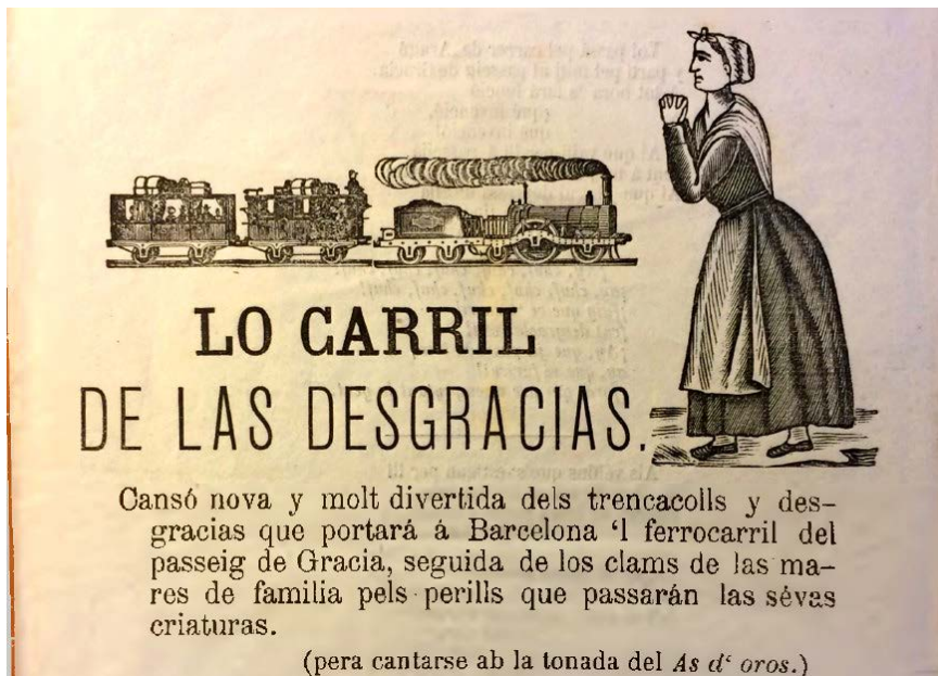
FIGURA 3. Lo carril de las desgracias , fullet anònim, Barcelona, Imprenta de Lluís Tasso, 1902.

Dos carrils are's volen casà, no pas per amor sino per negoci; diu que'l dot á tots dos tentà ¡qui ho creurà, qui ho creurà!