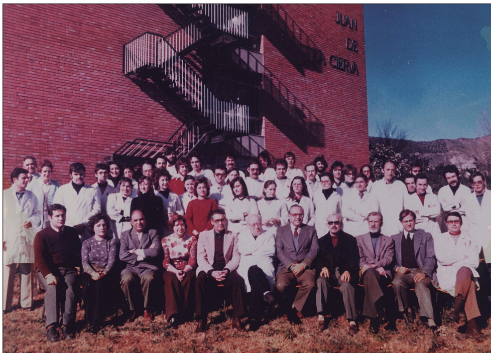
FIGURA 2. El col·lectiu de l'Institut de Química Orgànica l'any 1973.