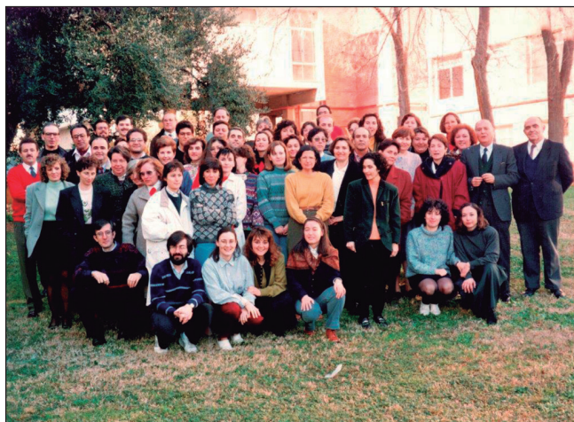
FIGURA 3. El col·lectiu de l'Institut de Tecnologia Química i Tèxtil als anys noranta.