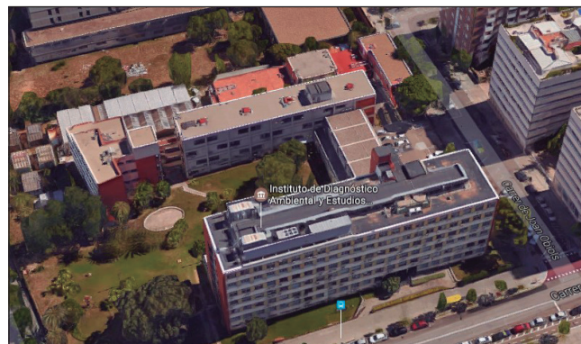
FIGURA 4. Panoràmica del CID en l'actualitat.

El segon projecte al CID serà la creació de l'Institut de Química Avançada de Catalunya (IQAC), el qual aplegarà, de manera no tan uniforme temàticament, grups que treballen en