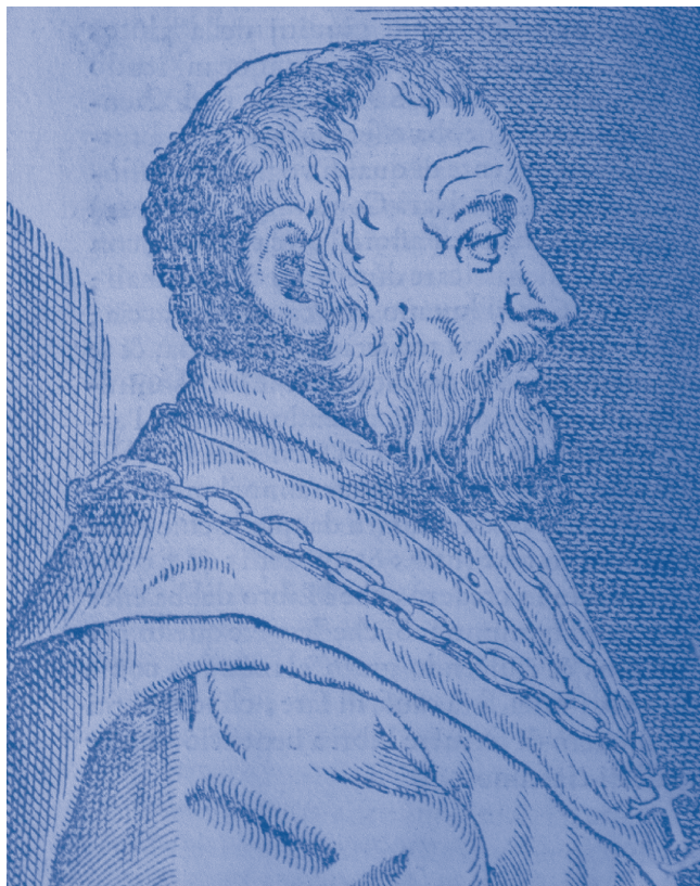
FIGURA 1. Leonardo Fioravanti, autor de Dello Specchio di Scientia Universale (1572).

Posteriorment es van substituir el plom i l'estany per una amalgama d'estany (per exemple, en els miralls que emprava Newton), amb els problemes de salut per als treballadors derivats de l'ús de mercuri. Les tècniques per a fer miralls al segle XVI es poden trobar descrites en el llibre de Leonardo Fioravanti (figura 1) El mirall de la ciència universal . 3 Aquest llibre és un recull dels coneixements de l'època, que recorda la Histò-