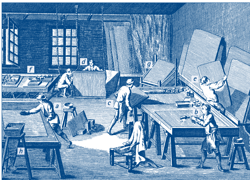
FIGURA 2. Taller de fabricació de miralls descrit a l' Encyclopédie de Diderot i D'Alembert, en el qual es veuen obrers en les tasques de desengreixar un full d'estany (a), abocar mercuri ( vif-argent ) sobre un full d'estany (b), col·locar un vidre sobre el full d'estany (c) o posar miralls sobre escorredors (d i g). Es veu també a la part inferior esquerra (h) una tremuja per a separar el mercuri d'altres residus.

fluïdesa del vidre). Una altra tècnica consistia a fer vidres bufats cilíndrics que eren tallats transversalment i aplanats per reescalfament sobre una superfície plana, 6 que ja a començaments del segle xv permetia fer làmines de vidre d'aproximadament un metre de costat a Alemanya, França i Itàlia. Va ser Bernard Perrot, cap al 1680, qui va desenvolupar la tècnica de colat del vidre fos sobre una superfície plana, que va permetre fer miralls més grans dels que s'aconseguien amb els mètodes emprats fins aleshores. Aquest procés de fabricació és el que es recull a l' Encyclopédie (figura 2).