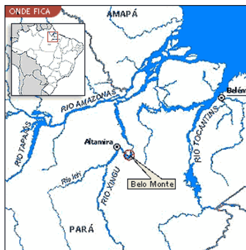
MAPA 1. La regió de Xingu en el sistema hidrogràfic del riu Amazones