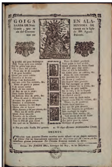
FIGURA 2. Goigs de Nostra Senyora de Gràcia que es veneraven al convent dels agustins de Palamós, < https://mediatheques.montpellier3m.fr/DEFAULT/doc/IFD/ESTAMPE_9010/goigs-en-alabansa-de-nostra-senyora-de-gracia >.

Déu de Gràcia, vetlladora dels mariners, que es festejava acompanyada del cant dels goigs: «Se ha pagat la imprecio de 100 estampas grans, 200 de petites y 300 goigs de N a S ra de Gracia 5 lliuras 12 sous 6». 116