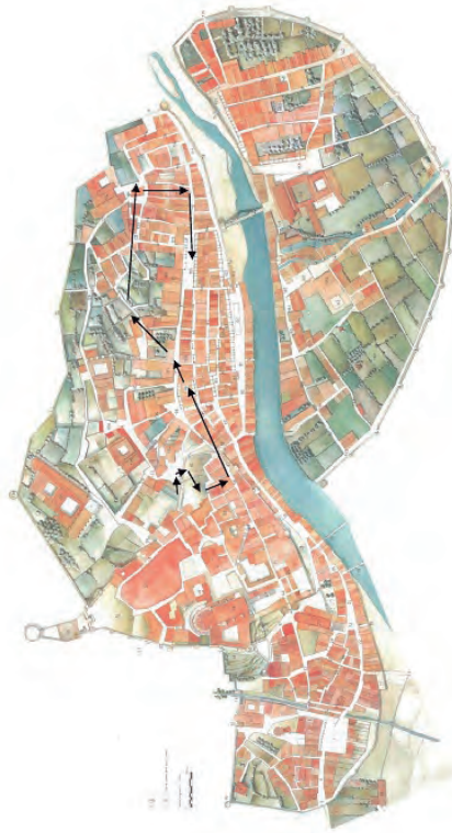
FIGURA 2. Recorregut de la processó de Sant Narcís. Plànol dels burgs de Sant Pere de Galligants, Sant Feliu, la Força Vella i de l'Areny i Vilanova de Girona. Font: Josep CANAL (et al.), La ciutat de Girona l'any 1535 (Girona, Ajuntament de Girona, 1995). S'indica el recorregut des de la seu fins a l'església de Sant Feliu.

que tenien resposta per part de la capella de cantors. Es continuaven cantant una sèrie d'himnes que, primer, entonaven els xantres i que eren contestats per la resta de la capella o per l'orgue. També hi havia joglars, «musicis vulgariter dictis» que esperaven al cap de l'escala mentre arribava una imatge de la Verge Maria. Llavors els xantres entonaven una antífona dedicada a la Verge que es repetia, si era menester, fins que el bisbe arribés a l'altar major. La processó parava a la plaça de Sant Feliu, passant per la plaça de les Cols i per la plaça del Vi, on es cantava un motet en honor a sant Narcís. 12 El recorregut que feia la processó de Sant Narcís el 18 de març era el següent: