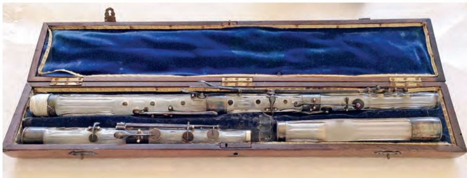
FIGURA 20. Estoig original de la flauta MDMB145 on encaixa el cos de recanvi (a baix a l'esquerre).

Així mateix, hi havia l'espai inequívoc per a un cos de recanvi, i hi encaixava perfectament el suposat fragment . Quedava, així, demostrat que es tracta en realitat d'una part de recanvi opcional de l'exemplar MDMB145, amb extensió fins al do 3 per a substituir, quan així es volgués, la part original que baixa fins al si 2 . En el segon estoig s'acomodava perfectament la flauta MDMB139.