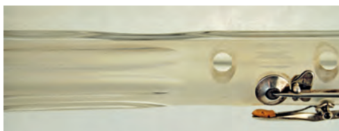
FIGURA 12. Detall del cos superior de l'exemplar MDMB149. Es pot apreciar el modelat del tub per a recolzar amb comoditat la mà esquerra.

Les flautes de Laurent ofereixen certs detalls ergonòmics únics, pensats per a la comoditat de l'intendent. El tub presenta un lleu modelatge en les parts on van recolzades les mans, i al voltant de l'embocadura s'ha esmerilat el vidre per tal que rellisqui menys al contacte amb la pell de l'intendent.