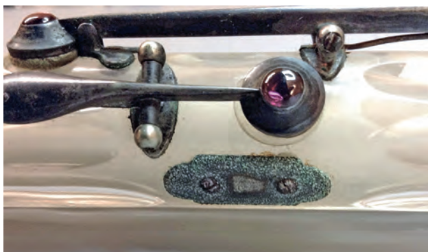
FIGURA 17. Detall de l'exemplar MDMB145 amb l'aplicació metàl·lica sota la clau del si \flat .

Un dels enigmes d'aquest exemplar és la presència de tres inusuals aplicacions metàl·liques prop de les claus de sol \sharp , de si \flat i de la clau llarga de fa. Aquestes peces obturen uns forats en el vidre que possiblement van quedar al descobert en modificar el lloc de fixació de les claus. Es podria tractar de l'encàrrec d'algun propietari posterior que tenia les mans més petites i no arribava còmodament a la ubicació original. Al costat d'aquestes peces metàl·liques s'observen, també, uns diminuts orificis cònics taponats directament en el vidre, presumiblement també com a conseqüència d'aquesta modificació.