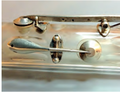
FIGURA 3. Sistema de platines cargolades al tub ideat per Laurent. Detall de l'exemplar MDMB149.

Aquest sistema innovador va representar un gran avenç en la construcció dels instruments de vent, i va facilitar l'addició de més claus i de mecanismes més complexos. Progressivament, els constructors de tots els països van adoptar aquest sistema de fixació, el qual segueix vigent encara avui en dia.