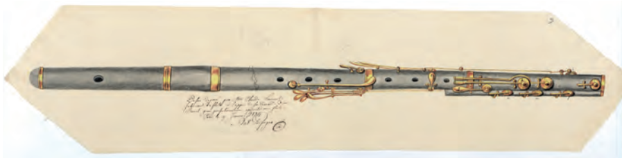
FIGURA 4. Dibuix de Laurent per a la patent de 1834.

les noves aportacions permeten tocar més fàcilment i emetre les notes greus amb gran facilitat. 28