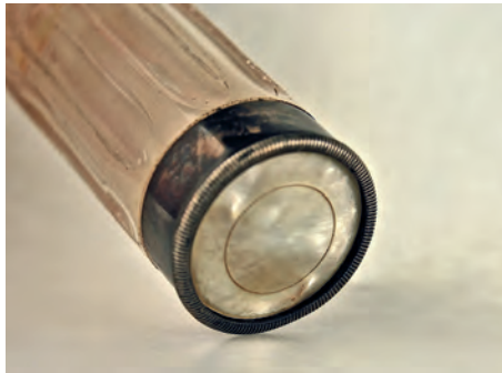
FIGURA 15. Tap de l'exemplar MDMB145.

El mecanisme presenta nou claus, les mateixes vuit descrites en l'exemplar anterior i una novena que correspon al si 2 . El tap del cap és ornamentat amb nacre i presenta com a obturador un disc de vidre d'uns 6 mm fixat amb resina. Li manca la baioneta de subjecció, encara que s'aprecia la marca del lloc on es trobava fixada. No té bombí d'afinació.