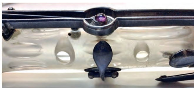
FIGURA 16. Detall de l'exemplar MDMB145.

Un dels enigmes d'aquest exemplar és la presència de tres inusuals aplicacions metàl·liques prop de les claus de sol \sharp , de si \flat i de la clau llarga de fa. Aquestes peces obturen uns forats en el vidre que possiblement van quedar al descobert en modificar el lloc de fixació de les claus. Es podria tractar de l'encàrrec d'algun propietari posterior que tenia les mans més petites i no arribava còmodament a la ubicació original. Al costat d'aquestes peces metàl·liques s'observen, també, uns diminuts orificis cònics taponats directament en el vidre, presumiblement també com a conseqüència d'aquesta modificació.