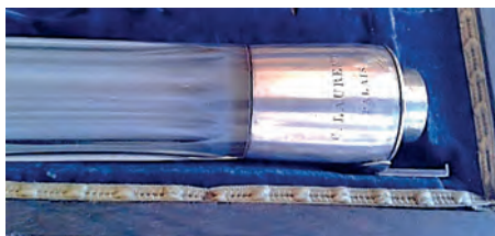
FIGURA 19. Detall de l'encaix de la baioneta de seguretat dins l'estoig.

Analitzant amb detall els exemplars del Museu, vaig començar a considerar que el fragment estimat com a part d'una possible tercera flauta podia ser el que es coneix com a «cos de recanvi». 61 Les similituds de mesures i perfils d'aquest fragment amb les de l'instrument MDMB145 m'ho feia pensar. Vaig demanar als conservadors del Museu si existien encara els estoigs originals: veure la caixa d'origen podria aportar informació determinant sobre aquest aspecte. Afortunadament, se'n conservava un parell on semblava que podien encaixar aquests exemplars. En obrir el primer, el més gran dels dos, es va fer palès que pertanyia inqüestionablement a una de les flautes de vidre ja que l'estoig presentava l'espai perfecte amb la forma i mesura de la baioneta de seguretat pròpia únicament dels instruments de Laurent.