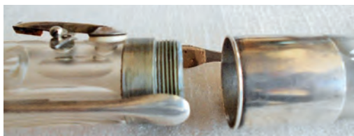
FIGURA 9. Encaix dels cossos superior i inferior per mitjà d'una rosca. Exemplar MDMB149.

La gran anella d'argent que uneix el cap i el cos superior porta la inscripció: «Laurent à Paris 1839 / Palais Royal n.º. 65 / Breveté». 55 De la part posterior d'aquesta anella surt una petita baioneta o ganxo que actua d'element de seguretat pel fet de no haver-hi rosca en aquesta secció, ja que dificultaria l'ajust precís de l'embocadura segons el gust i les necessitats de l'intèrpret. Així mateix, com es pot veure en la figura 10, a l'interior disposa d'un bombí d'afinació, que permet acomodar en diferents posicions l'encaix del cap amb el primer cos, de manera que es pugui modificar amb facilitat l'alçada del diapasó de l'instrument.