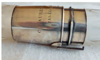
FIGURA 11. Encaix del cap i el cos superior de l'exemplar MDMB149 amb la baioneta de seguretat.