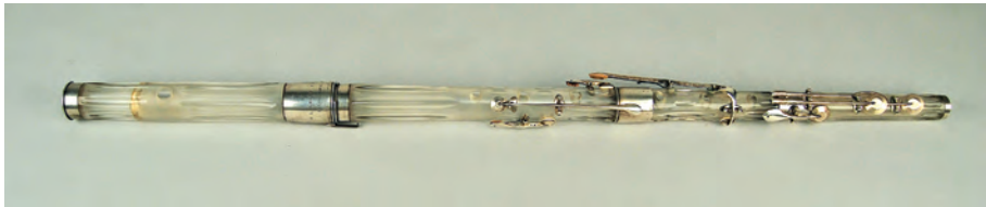
FIGURA 6. Exemplar MDMB149, París, 1839.

La flauta catalogada com a MDMB149 va ser construïda a París el 1839. És de vidre fos incolor, amb juntes i mecanisme d'argent, secció cònica i dividida en quatre parts: cap, cos superior i peu, tot i que, com en molts instruments de Laurent, el cos inferior i el peu es troben soldats. Consta de sis orificis oberts destinats a ser tapats directament pels dits i vuit claus corresponents al si b , do, sol # , clau llarga de fa, clau curta de fa, re # , do greu i do # greu, i la seva nota fonamental és un do 3 . El vidre presenta una talla acanalada amb la finalitat de treure-li pes, atès que el gruix és considerable —al voltant de 5 mm. L'interior del tub està esmerilat per tal d'aconseguir una superfície més porosa del vidre, aspecte