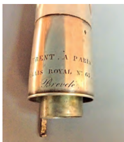
FIGURA 10. Anella d'argent del cap de l'exemplar MDMB149.

La gran anella d'argent que uneix el cap i el cos superior porta la inscripció: «Laurent à Paris 1839 / Palais Royal n.º. 65 / Breveté». 55 De la part posterior d'aquesta anella surt una petita baioneta o ganxo que actua d'element de seguretat pel fet de no haver-hi rosca en aquesta secció, ja que dificultaria l'ajust precís de l'embocadura segons el gust i les necessitats de l'intèrpret. Així mateix, com es pot veure en la figura 10, a l'interior disposa d'un bombí d'afinació, que permet acomodar en diferents posicions l'encaix del cap amb el primer cos, de manera que es pugui modificar amb facilitat l'alçada del diapasó de l'instrument.