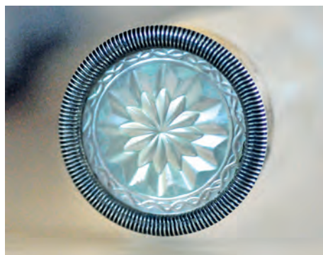
FIGURA 7. Tap amb treball de nacre de l'exemplar MDMB149.

que influeix positivament en la flexibilitat i qualitat sonora de l'instrument. 54 El tap de l'extrem superior del cap està ornamentat amb nacre artísticament treballat en forma de rosetó, treball delicadíssim i extraordinari. L'orifici de l'embocadura es troba delicat i perfectament tallat directament en el vidre amb total precisió.