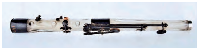
FIGURA 18. Fragment. Museu de la Música de Barcelona.

Analitzant amb detall els exemplars del Museu, vaig començar a considerar que el fragment estimat com a part d'una possible tercera flauta podia ser el que es coneix com a «cos de recanvi». 61 Les similituds de mesures i perfils d'aquest fragment amb les de l'instrument MDMB145 m'ho feia pensar. Vaig demanar als conservadors del Museu si existien encara els estoigs originals: veure la caixa d'origen podria aportar informació determinant sobre aquest aspecte. Afortunadament, se'n conservava un parell on semblava que podien encaixar aquests exemplars. En obrir el primer, el més gran dels dos, es va fer palès que pertanyia inqüestionablement a una de les flautes de vidre ja que l'estoig presentava l'espai perfecte amb la forma i mesura de la baioneta de seguretat pròpia únicament dels instruments de Laurent.