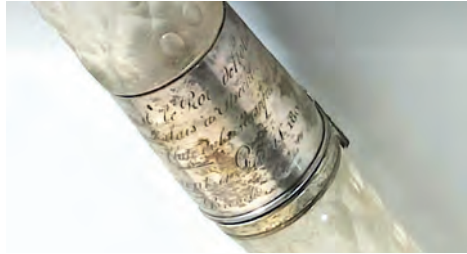
FIGURA 5. Detall de la flauta regalada per Lluís Napoleó a Drouët (Amsterdam, Rijksmuseum, NG475).

Le 11 décembre, le flûtiste Drouet, une de nos anciennes connaissances, vint donner un concert. Il exécuta ses différents morceaux sur un instrument en cristal. La singularité du fait attira grand nombre de curieux.