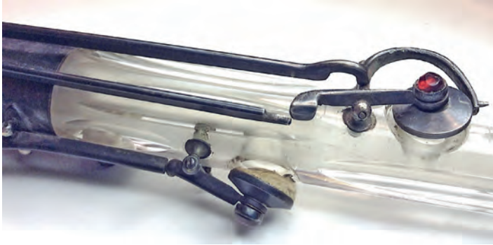
FIGURA 14. Detall de l'exemplar MDMB145.

L'exemplar MDMB145 porta la inscripció: «Laurent à Paris 1844 / Palais Royal n°. 65 / Breveté». És també de vidre incolor, amb talla acanalada, mecanisme i anelles d'argent. Té incrustacions de vidres vermells i malves als plats de les claus; probablement es tracta d'ametistes i robins, joies que Laurent utilitzava sovint per tal d'ornamentar els instruments més sumptuosos. 59