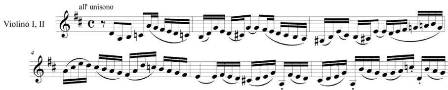
EXEMPLE 4. Christe , fraseig de violins, Johann Sebastian Bach.

corbes pròpies de l'estil esmentat. Així, els dissenys melòdics dels violins en semicorxera en graus conjunts ascendents, descendents, arpegiats, amb salts d'octava i l'articulació que en fa Bach en són un bon exemple (exemple 4). En canvi, en Harrer hi apareix el fraseig específicament galant: frase curta, periòdica i articulada (exemple 5), fraseig que s'apropa molt al que estava en voga en la música operística del moment. Així, porto a col·lació un fragment de l'òpera Il più bel nome (1708) (exemple 6), d'Antonio Caldara, en el qual s'observa, clarament, la similitud de fraseigs entre ell i Harrer.