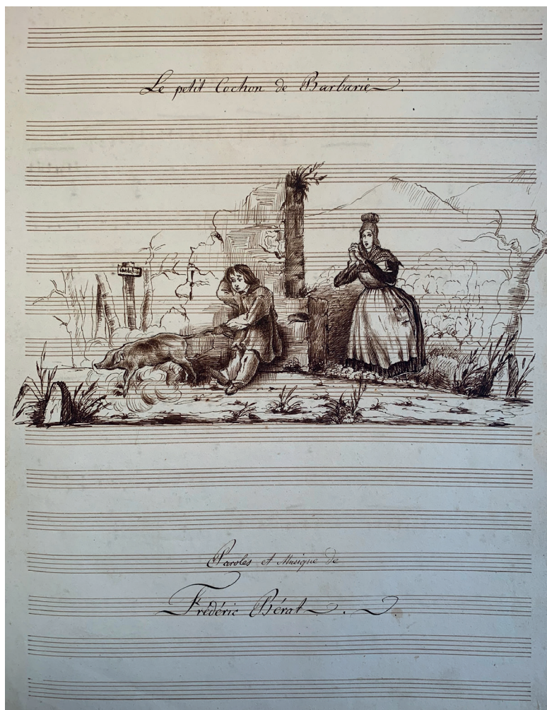
FIGURA 1. Dibuix a ploma que il·lustra el manuscrit Le petit cochon de Barbarie , de Frédéric Bérat. S'aprecia el nom «Carles» en un rètol d'un arbre i uns rostres figuratius al fons, al costat d'un arbre amb el tronc desplaçat.