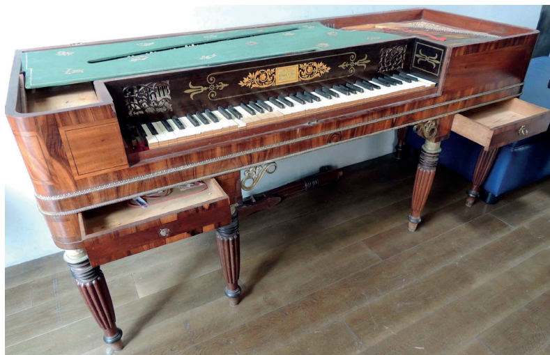
FIGURA 8. Clementi & Co., 1818. Vallès Occidental.