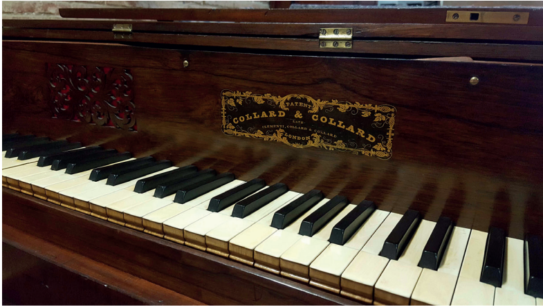
FIGURA 7. Collard, late Clementi, Collard & Collard, 1843. Etiqueta autèntica. Vallès Oriental.

truir pianos de tan buenas circunstancias como las que le sirvió de modelo. Así lo apreciaron las personas entendidas, así se sancionó por el tribunal competente en la Exposición de los objetos de la industria española de 1845, premiándole con la medalla de plata.