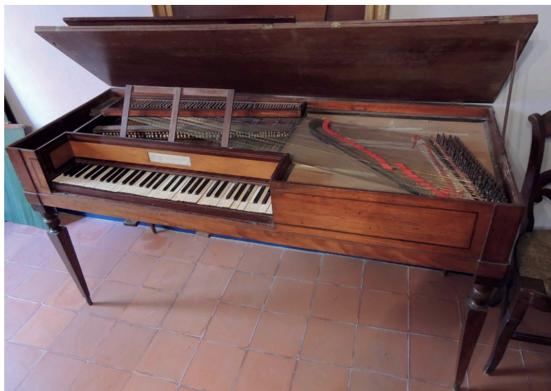
FIGURA 3. Piano Andrés Puig, 1813. Vallès Oriental.