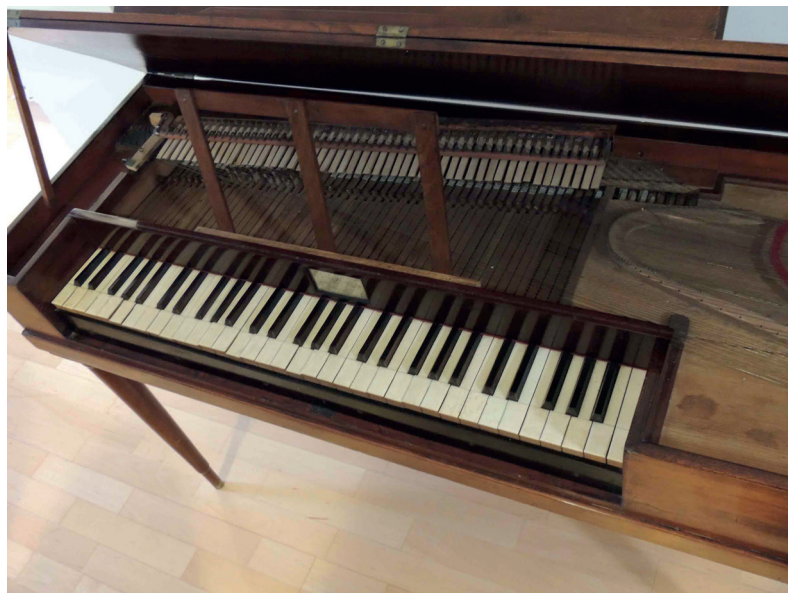
FIGURA 4. Piano Juan Munné, 1805? Barcelona.