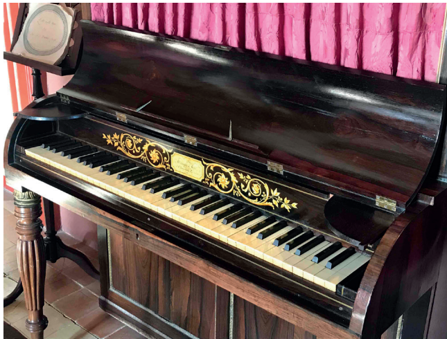
FIGURA 2. Piano Clementi & Co. de la Masia d'en Cabanyes. Vilanova i la Geltrú.

Aquest piano (núm. 8) és un model vertical, de tipus armari (figura 2). El seu valor principal resideix en el seu origen: va ser adquirit pel seu propietari, Josep