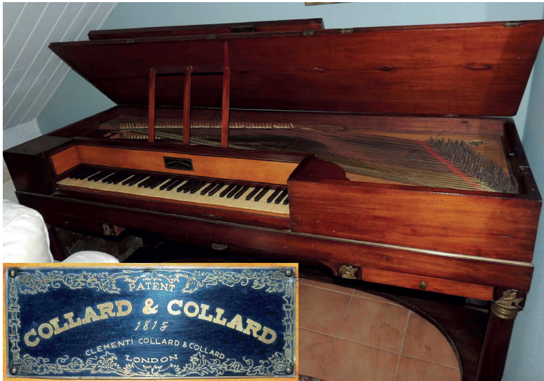
FIGURA 6. Fals Collard & Collard, 1815? Maresme.

anys (figura 7). Així, la d'aquest piano no es correspon amb la marca ni per estil ni per data. Analitzant-ne alguns detalls tècnics, podem corroborar que el piano no es correspon amb l'etiqueta que exhibeix. La fusta de les palanques de les teclcs és de pi, mentre que els pianos de Clementi i de Collard eren de fusta de til·ler. El pedal és de genoll, i una anella al seu costat, un topall i la resta d'un altre a l'interior, a l'esquerra del teclat, així com una obertura a l'extrem esquerre dels martells, suggereixen que hi havia hagut alguna palanca manual per accionar un dispositiu perdut. El mecanisme és anglès, d'acció simple i un sol pilotí, amb pernsguia al mànec del martellet, cosa anacrònica per a un piano de Collard. El piano és certament bonic, però la seva estètica s'allunya molt dels Clementi i dels Collard & Collard i ens recorda més la d'un Érard o d'un piano fet a la península Ibèrica.