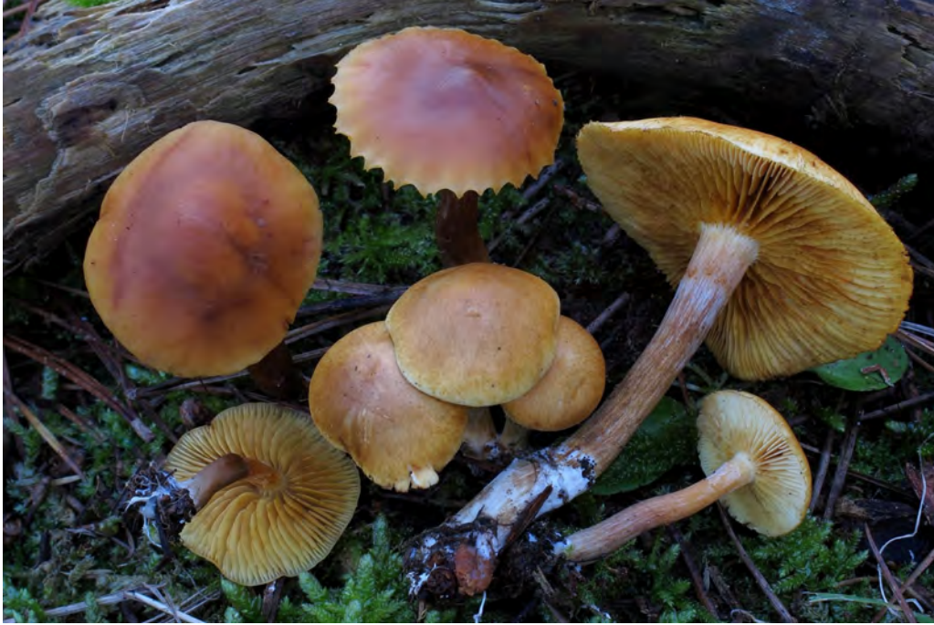
Gymnopilus arenophilus A. Ortega & Esteve-Rav.