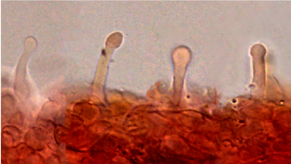
Gymnopilus arenophilus A. Ortega & Esteve-Rav. Queilocistidis.

exemplars vells, de color semblant al del barret, o més pàl·lid, fibril·lós longitudinalment, amb la base recoberta de restes blanquinoses del vel. La carn és blanquinosa o lleugerament groguenca, sense olor destacable i de gust suau. Esporada de color ocre ferruginós.