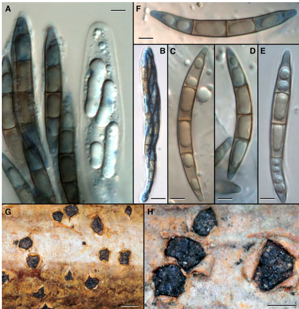
Fig. 2. Aspecte general, ascis i ascòspores de Melogramma campylosporum . A , ascis en diferents estats de maduració; a l'esquerra, dos ascis madurs amb la paret evanescent i les ascòspores ja madures, triseptades i pigmentades, i, a la dreta, un asc immadur, amb la paret clarament visible, i les ascòspores immadures, encara no septades, sense pigmentar, i amb una gran gota lipídica al seu interior. B , asc madur octosporat. C-F , Ascòspores madures, amb la pigmentació més marcada en les cèl·lules medials que en les apicals. G-H , Aspecte general dels estromes, que afloren trencant l'escorça de la planta suport.- A-F, preparacions muntades en lactofenol-blau cotó. Escales: A, C-F = 5 µm, B = 10 µm, G = 4 mm, H = 2 mm.

(ELLIS & EVERHART, 1892; LAFLAMME, 1976)) i es coneixen també citacions de Xina atribuïdes a aquest fong (TENG, 1934).